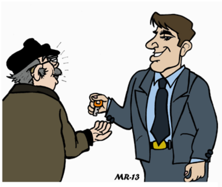
Piiros 5. Maskuliinisuus palveluresurssina