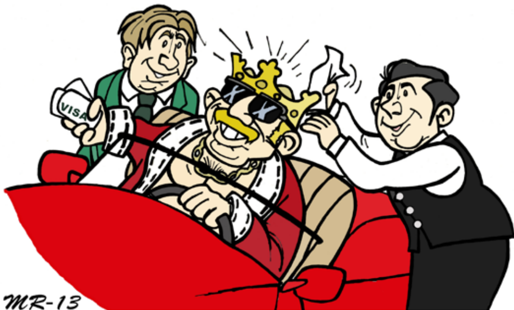
Piirros 1. Kuluttaja kuninkaana.