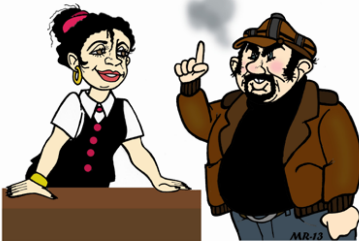
Piirros 2. Hallitut tunteet asiakastyössä

Olen ollut asiakaspalvelutyössä hyvin pitkään ja yksi haasteista liittyy juuri siihen vaadittavaan jatkuvaan pirteyteen ja iloisuuteen. Arkielämän stressi – sekä henkilökohtaiset että työasiat – saavat hymyn helposti katoamaan työpäivän kuluessa. Omia tunteita (niitä negatiivisia siis) on pakko piilottaa, jos on tiskin toisella puolella, kun taas asiakkaat saavat purkaa paha mieltään minuun. Positiivinen palaute tekee hyvän päivän, mutta koko päivä voi mennä myöskin pilalle, jos kuulee yhdenkin valituksen (--). (Asiakaspalvelija, nainen, -)