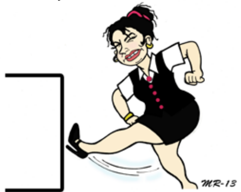
Piiros 3. Asiakaspalvelija purkaa tunteensa takahuoneessa

Sitaatissa asiakaspalvelija purkaa asiakkaan haukut piilossa – potkii pakastinta takahuoneessa – koska niiden julkinen esittäminen ei ole hänen roolissaan sallittua (Piiros 3). Asiakkaan oikeutta haukkua asiakaspalvelija ei tarinassa kyseenalaisteta, vaan asiakaspalvelijan on tämän silmissä oltava rauhallinen , siis synnyttää illuusio tai vaikutelma myönteisestä ja hallitusta ilmapiiristä. Tällaisessa esityksessä ärtymyksen eli kielteisen tunteen ilmaiseminen on kiellettyä ja ”väärin”. Se on asiakaspalvelijan rooliin kohdistuvien odotusten vastaista eli rooli hallitsee ja rajoittaa toimijan liikkumavaraa. Esityksessä tulee toimia rooliasetelman ja normien mukaisesti sekä tarvittaessa ”henkilökohtaisen roolin” vastaisesti, jotta toimii ”oikein”.