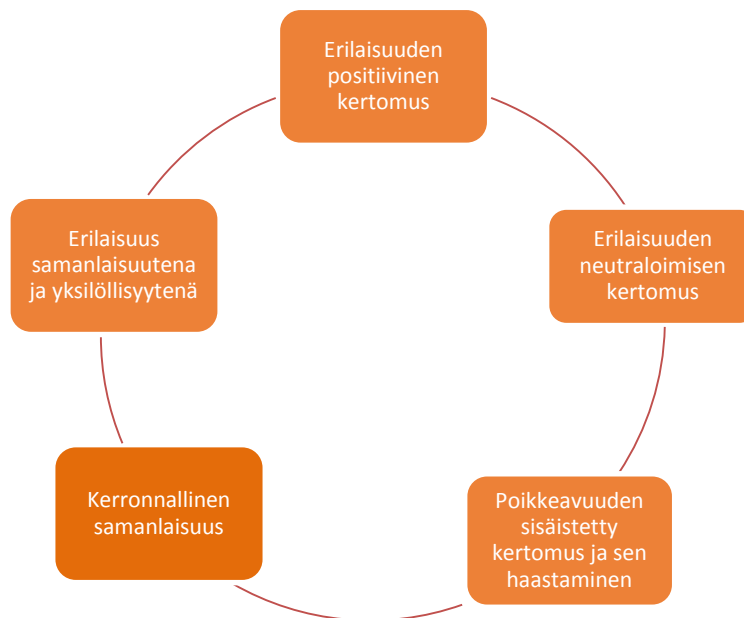
Kaavio 2. Samanlaisuuden ja erilaisuuden kertomukset

Alapuolella näkyvä kaavio (kaavio 2) kuvaa aineistosta esiin nostamiani erilaisuuden ja samanlaisuuden kertomuksia. Kertomukset ovat sijoitettuna kehälle, joka kuvaa niiden yhteyttä jäsenyyksiin ja niistä neuvottelemiseen: samaistumisen ja erottumisen kertomuksilla luodaan ryhmiä ja rajoja, ja ne myös kuvaavat vahvasti sitä, mitä jäsenyyksiä yksilö kokee itsellensä mahdollisiksi. Yhtenevä kehä kuvaa myös sitä, kuinka kertomukset täydentävät toisiaan ja linkittyvät yhteen: jokaisen haastateltavan kerronnassa ilmeni piirteitä useasta kertomuksesta. Vaikka kertomukset ovat erillisiä, ne muodostavat yhdessä sen kokonaisuuden, jolla jäsenyyksien, erottumisen ja samaistumisen kokemuksia kerrotaan.