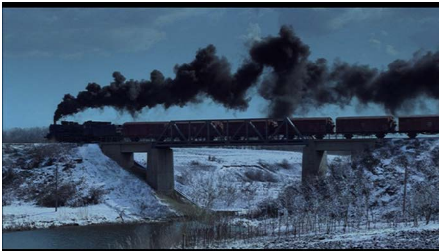
Kuva 1 ( Aamen )