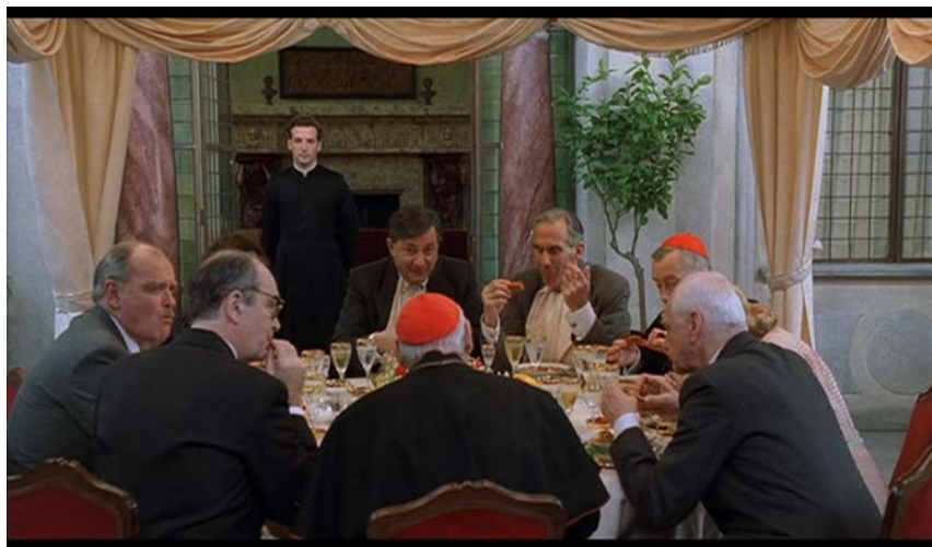
Kuva 4 ( Aamen )