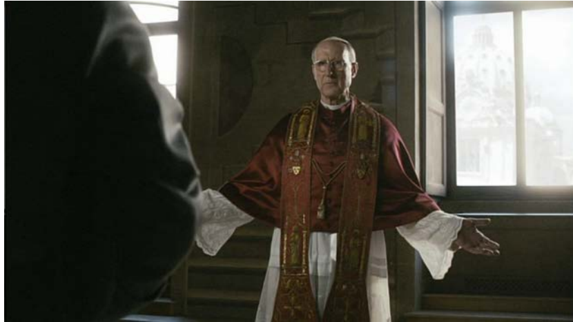
Kuva 7 ( Under the Roman Sky )