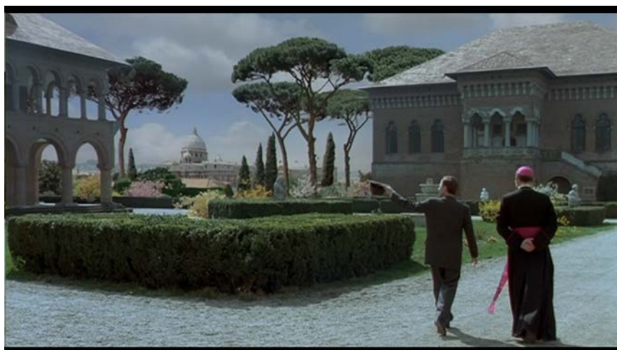
Kuva 5 ( Aamen )