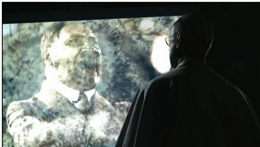
Kuva 9 ( Under the Roman Sky )