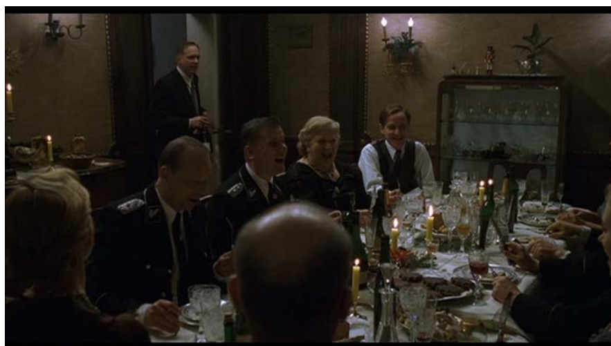
Kuva 3 ( Aamen )