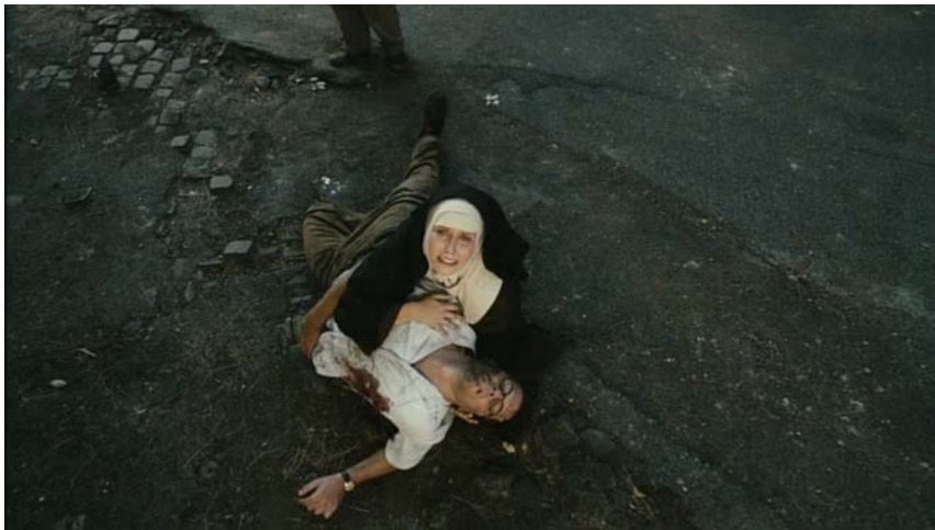
Kuva 8 ( Under the Roman Sky )