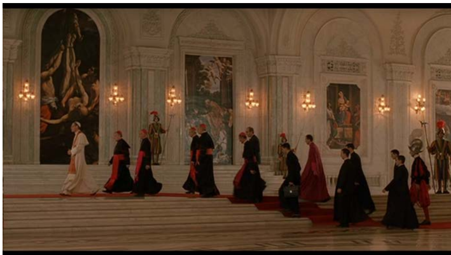
Kuva 2 ( Aamen )