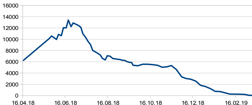
Kuvaaja 1: Vankien lukumäärä Helsingin vankileireillä. Fångvårdskommisionens protokoll. He 1. Muut sisällön mukaan järjestetyt asiakirjat 1918. Sotavankilaitos. KA; Sotavankileirien viikkoraportit. Ec 4. Sotavankilaitos. KA; Pakkotyölaitosten viikkoraportit. Ha 2. Vankeinhoitohallitus. KA.