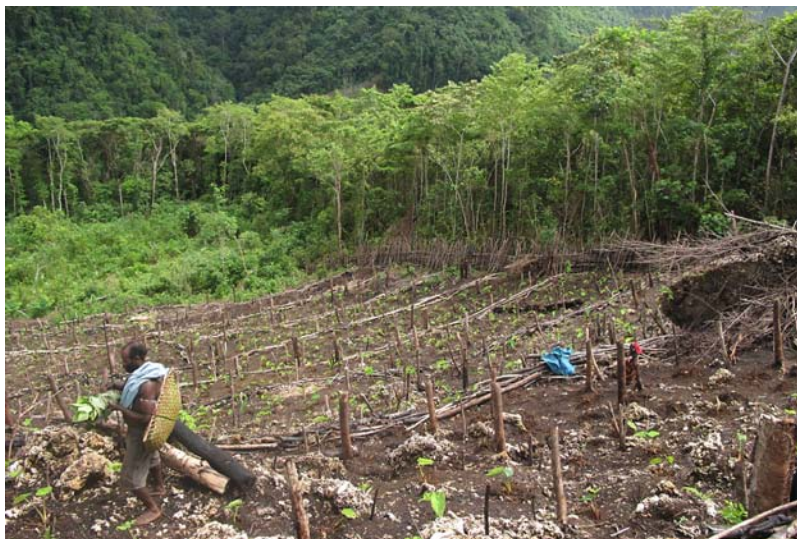
Kuva 2. Vuorenrinteellä oleva kaskipuutarha. Maahan kasatut puupinot merkitsevät yksittäisten palstojen rajoja. Puutarhan raivaaja jakaa palstat niitä viljeleville naisille erilaisten sukulaisuus- ja ystävyyssuhteiden mukaan (Tuomas Tammisto).

uudelleen noin kuuden seitsemän vuoden päästä sen hylkäämisestä. Tässä välissä paplii on muuttunut mlaapiksi . Molemmat tyytit voidaan laskea niin sanotuksi sekundäärimetsäksi.