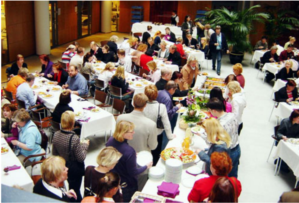
Iltapala viineineen maistui Biomedicum in pohjakerrokseen järjestetyissä pöydissä.