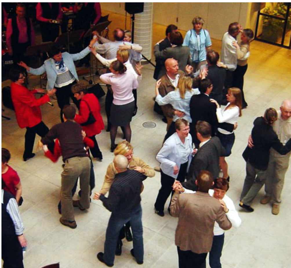
Vauhti sen kuin paranee illan tummetessa.