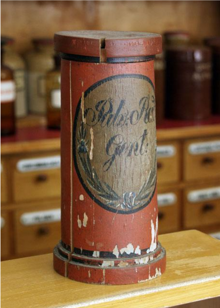
Puinen astia (Pulv. Rad. Gent) gentianakasvin juuren säilyttämistä varten. Raahen Apteekkimuseon kokoelmista. Kuvaaja Harri Hemmilä

Billmanin erittäin monivaikutteinen lääke ”Ädelt hästpulver” (n:o 9) sisältää seuraavia kasvikunnan tuotteita: katkeron juurta (”gentianarot”; mahdollisesti keltakatkeroa, Gentiana lutea ), katajanmarjoja (”enebär”), rohtokatajaa (”säfwenbom”, Juniperus sabina ), rohtokalmojuurta (”calmusrot”, Acorus calamus ) ja hajupihkaa eli pirunpaskaa (”dyfwelsträck”). Muita ainesosia ovat rikki (”swafwel”), raaka antimoni (”rå antimon”) ja puhdistettu salpietari (”renad salpeter”).