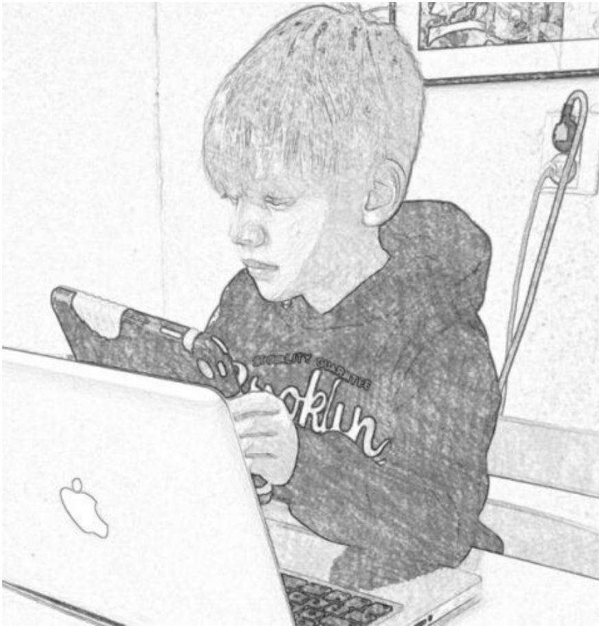
Kuva 1. Neuvon kysyminen valintatilanteessa tablet-tietokoneen avulla.

Analyysin viimeisessä vaiheessa keskityimme aineistosta yhteisesti valittujen episodien tarkasteluun. Nostamme aineistosta esiin viisi episodia, joiden avulla havainnollistamme kahden viisivuotiaan Minecraft-luomissession luonnetta ja siihen sisältyvää pedagogista funktiota, vertaisoppimista.