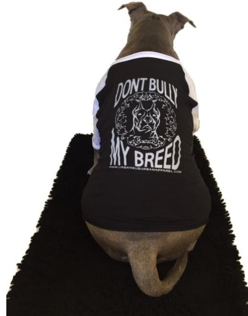
Kuva 3. Mainoskuva Urban Suburban Apparelin verkkomyntisivustolla keväällä 2015.