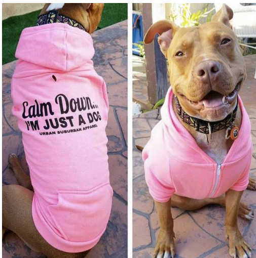
Kuva 4. Käyttäjän @urbsub Instagram-julkaisu 20.11.2015.