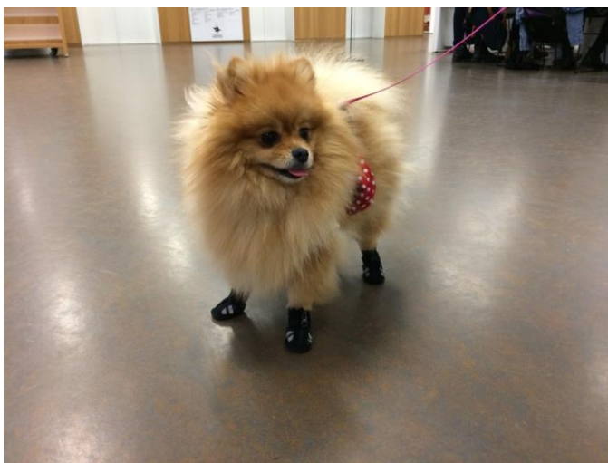
Kuva 1. Satunnainen koirakohtaaminen Helsingin yliopiston pääkirjastossa 15.11.2016.