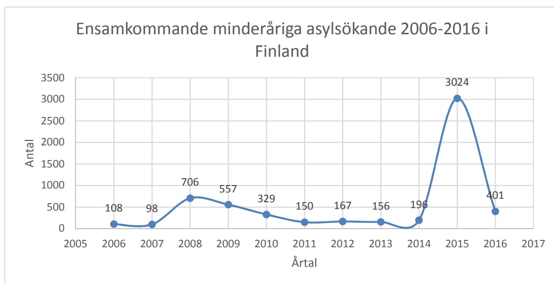
Figur 2: Ensamkommande minderåriga asylsökande 2006–2016 i Finland

Trenden för antalet ensamkommande minderåriga följer samma kurva. Migrationsverket (2017) har sedan 2006 bokfört hur många ensamkommande minderåriga som kommit till Finland som asylsökande flyktingar. Från att ha varit i snitt några hundra per år kom det över 3000 under år 2015. En sänkning i antal ensamkommande minderåriga märktes också från år 2015 till 2016.