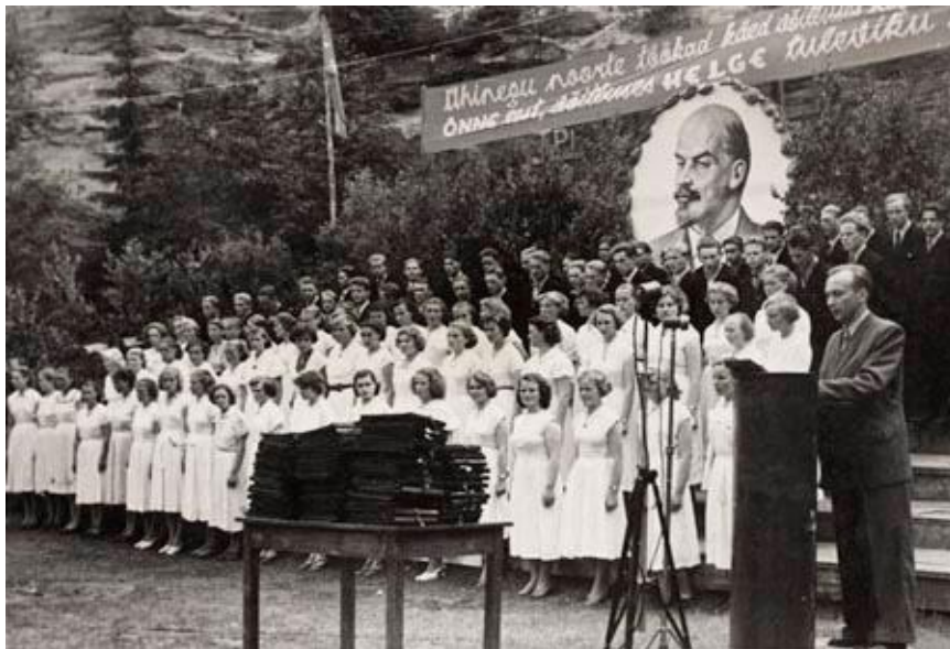
Kuva 6: Nuorten kesäpäivien todistusten jako Taevaskoda, Võru. "Liitykööt nuorten ahkerat kädet yhteen, säteilköön onni ja valoisa tulevaisuus". Kuva julkaistu omistajan luvalla.

Nuorten kesäpäivien päätösjuhla oli neuvostoyhteiskunnan sekulaari aikuistumisriitti ja sosialistisen kasvatuksen päätöstahtuma, jossa juhlittiin keskikoulunsa päättäneitä, poliittisesti täysinoppineita, aikuistuneita neuvostokansalaisia. Ohjaajille painotettiin, että Nuorten kesäpäivät ovat kaunis neuvostoperinne, ne eivät saaneet muodostua vain taisteliksi kirkollisia toimituksia vastaan. (Remmel 2008, 258.) Neuvosto-Viron luterilainen kirkko ei kieltänyt Kesäpäiville osallistuneita nuorilta mahdollisuutta myös konfirmaatioon kuten Itä-Saksassa, jossa kirkko kieltäytyi konfirmoimasta nuorisovihkimykseen osallistuneita (Köntti 1984). 1970-luvun lopulla Nuorten kesäpäivät alkoivat menettää omaleimaisuutensa. 1980-luvun kansallinen