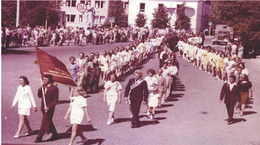
Kuva 5: Nuorten kesäpäivien juhlakulkue 1970 Kuressaaressa.