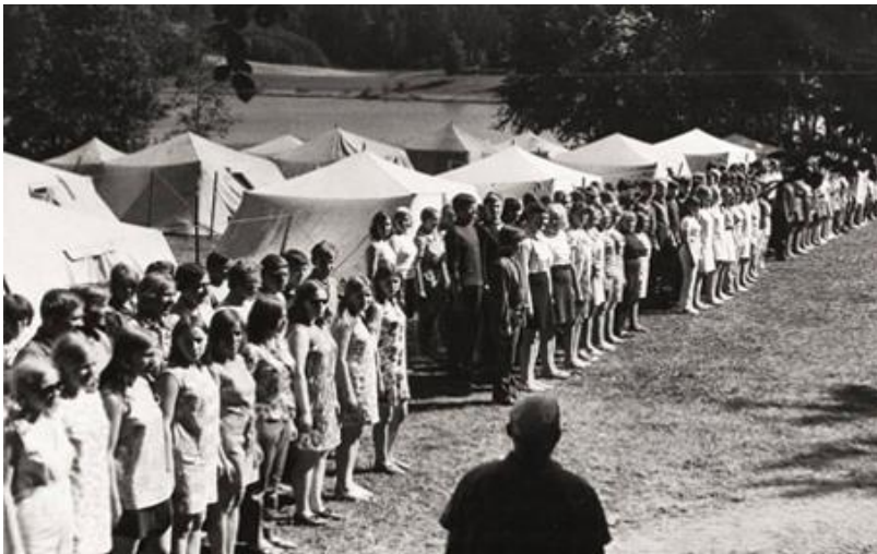
Kuva 4: Nuorten kesäpäivien telttaleiri Võrussa. Kuva julkaistu omistajan luvalla.

tekevät neuvostokansalaiset olivat neuvostoideologian tukipilari. (Remmel 2008, 258–259.)