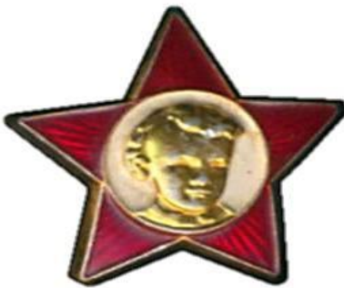
Kuva 1: Alakoululaisten tähtimerkki

Lapsi- ja nuorisjärjestöillä oli omat rintamerkinsä, joita pidettiin koulussa ja paikkakunnan tärkeissä tapahtumissa. Lokakuun lasten eli alakoululaisten tähtimerkki (Kuva 1). Punaisen tähden sisällä oli Leninin lapsuudenkuva. Pioneereille eli yläkoululaisille kuului punainen huivi ja liekkimerkki (Kuva 2). Punaisen tähden keskellä oli Leninin kuva ja sanat: "Aina valmiina!" Lippumerkkiä kantoivat Komsomoliin kuuluvat nuoret. Punaisen lipun keskellä oli Leninin kuva ja lyhenne: "VLKSM" eli Komsomol, Yleisliittolainen Leninin Kommunistinen Nuorisoliitto. (Kuva 3).