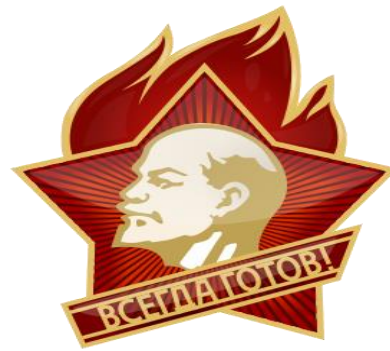
Kuva 2: Yläkoululaisen liekkimerkki