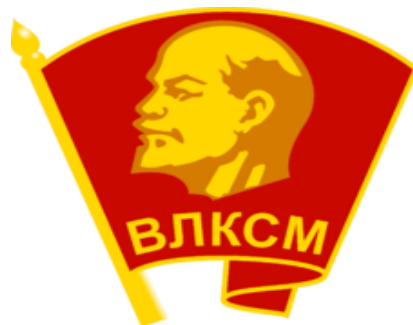
Kuva 3: Komsomoliin kuuluvien nuorten lippumerkki