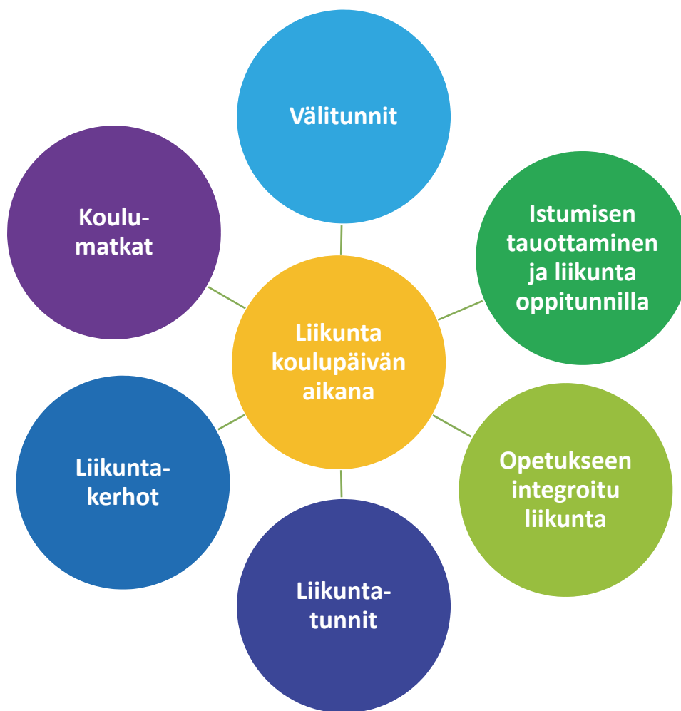
KUVIO 1. LIIKUNTA KOULUPÄIVÄN AIKANA.

laisista 43 %) ja kevyeen liikuntaan osallistuu vain 15 % oppilaista. Pojat liikkuvat välitunneilla enemmän kuin tytöt kaikilla luokkatasoilla (Turpeinen ym. 2015.) Ensimmäinen askel välituntiliikunnan lisäämisessä on ohjata oppilaat ulos välitunneilla. Vartin välitunnit jäävät usein lyhyiksi välituntien aktivoiminnan kannalta. Pidempiä toiminnallisia välitunteja saadaan rytmittämällä oppitunteja sopiviin jaksoihin. Suomen kouluista 55 prosentissa on käytössä pitkä, noin 30 minuuttia kestävä toimintavälitunti (Ståhl 2015), jonka aikana voidaan tarjota erilaisia välituntiliikunnan mahdollisuuksia ja kerhotoimintaa. Koulun käytävät, aulat ja liikuntasali tarjoavat tilaa liikkeelle varsinkin niinä vuodenaikoina, jolloin sää ei houkuttele toimimaan ulkona. Vertaisohjaajien kouluttaminen on keino lisätä liikkumista ja osallisuutta. Omaehtoista liikuntaa saadaan helposti lisää, kun oppilaat saavat vapaasti käyttää koulun liikuntavälineitä välitunneilla. Välineitä tulisi olla riittävästi ja niiden pitäisi olla helposti kaikkien oppilaiden saatavilla.