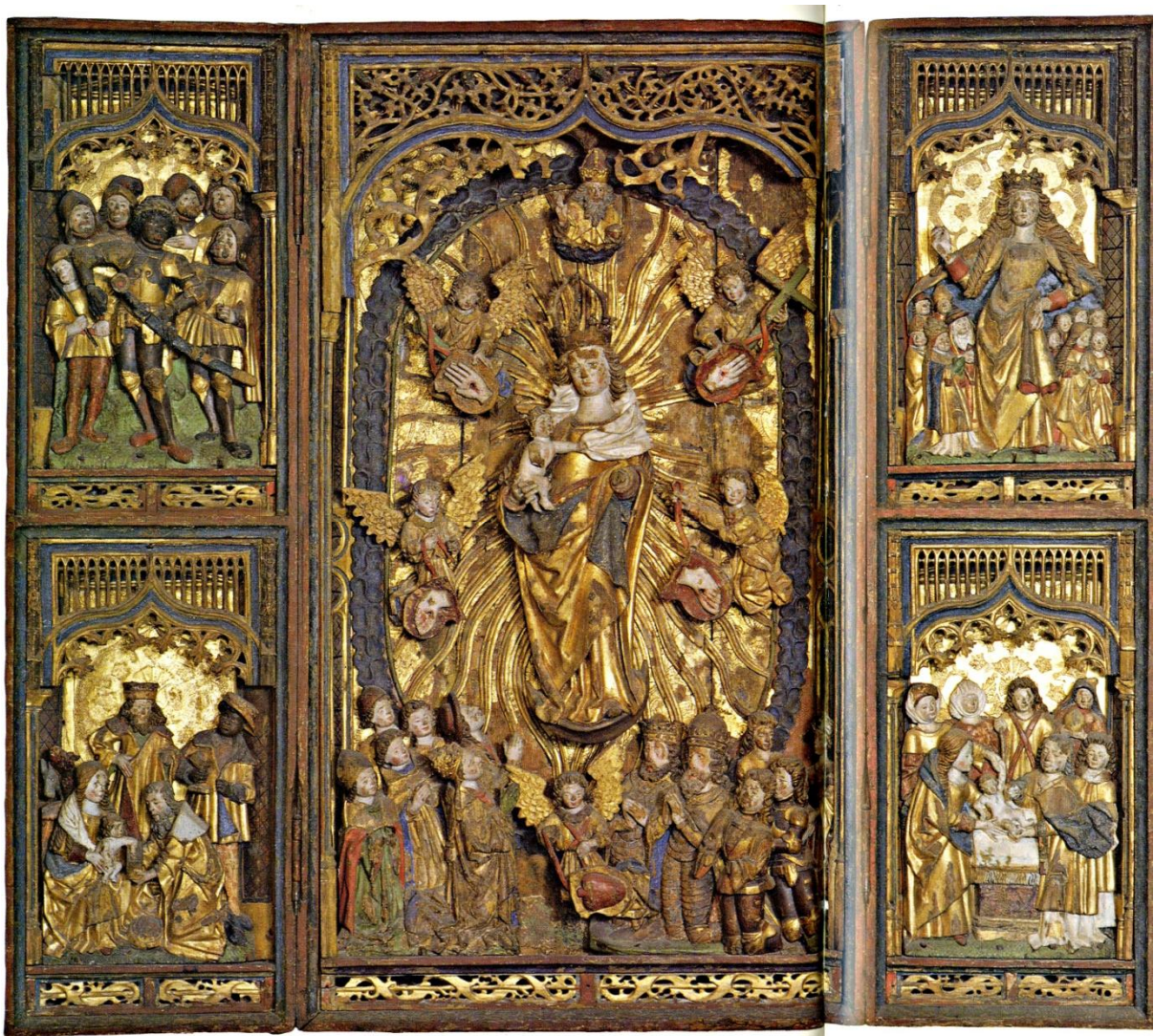
Kuva 10. Myöhäiskeskiaikainen alttarikaappi Someron kirkosta, luultavasti stralsundilaista työtä. Suomen kansallismuseo. (ARS 1; s. 218.)