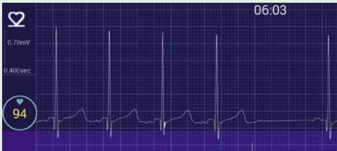
Kuva 2. Ka-peakompleksisessa takykardiapyrähdyksessä eteisaktiiviteetin signaali eroaa sinuslyönnin P-aalosta.

dollistavat pitkäaikaisen seurannan. Tutkimustulokset vaikuttavat lupaavilta mm. eteisvärinän ja kammioperäisten rytmihäiriöiden tunnistamisessa (11). Myös älyvaatteisiin ja jopa autoihin on kehitetty sydämen sähköisten tapahtumia rekisteröiviä laitteita. Toteutuksia on viljalti, ja seuraavassa esitellään lyhyesti muutamia Suomessa markkinoilla tai kehitteillä olevia ratkaisuja rytmihäiriöiden diagnostiikkaan.