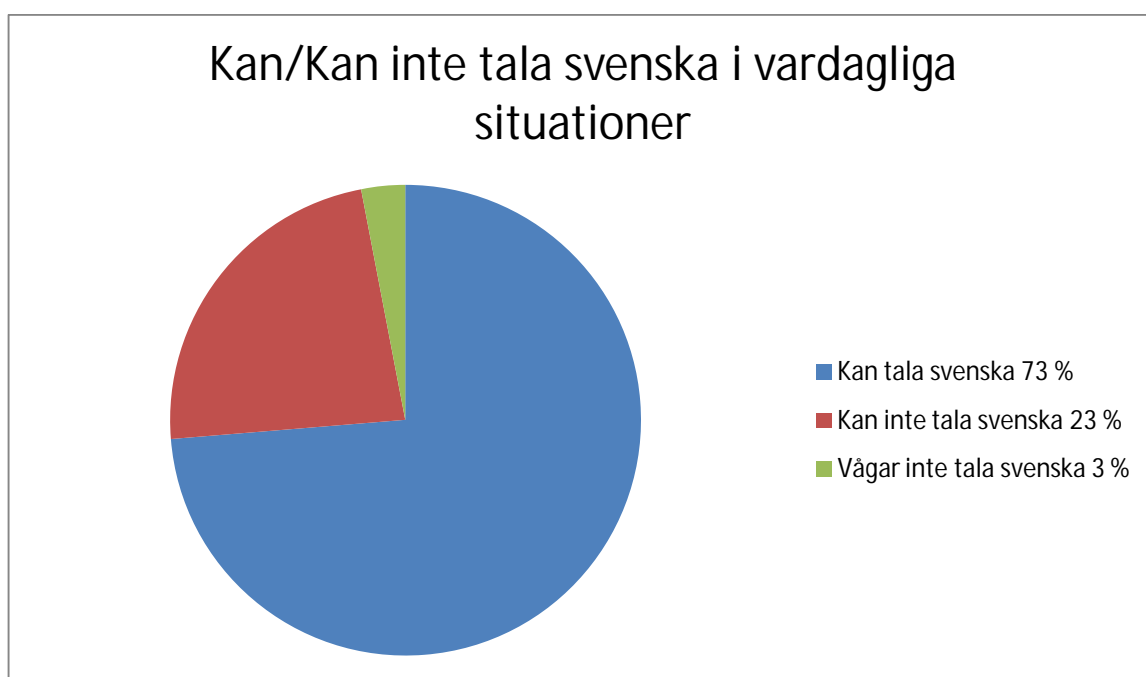
Figur 2. Kan/kan inte tala svenska i vardagliga situationer.

De flesta tror således att de kan klara av enkla servicesituationer på svenska, och de beskriver också hur de har använt svenska i Sverige. Eleverna i Havsvikens skola samtalar så här kring sina erfarenheter: