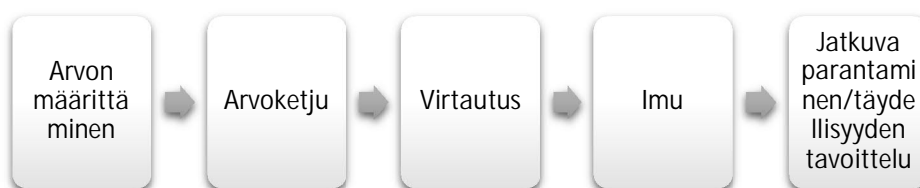
Kuva 1: Leanin viisi vaihetta

Leanin lupaus, jota on toistettu useassa tekstissä ja tutkimuksessa, on antaa asiakkaalle enemmän tekemällä vähemmän. Englanninkielinen sana lean tarkoittaa hoikkaa tai niukkaa , mikä selittää hyvin perusajatusta, jonka Womack, Jones ja Roos (1990) havaitsivat Toyotan tehtailla: massatuotantoon verrattuna lean käyttää kaikkea vähemmän, vaatii vähemmän työvoimaa, vähemmän työkaluja ja koneita ja ennen kaikkea vähemmän