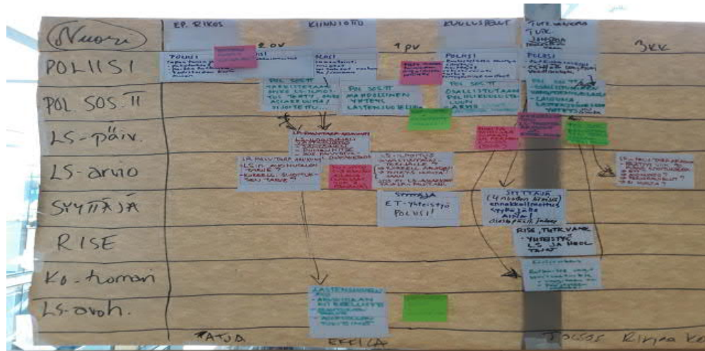
Kuva 2: työryhmän laatima arvovirtakuvaus:

Hines ja Rich (1997) ovat kehittäneet seitsemän selkeää työkalua arvovirtakuvauksen toteuttamiseksi, mutta mainitsevat samalla, että toteutusta helpottavia työkaluja on useita. Usein arvovirtakuvaus saattaa esimerkiksi olla yksinkertainen aikajana, johon merkitään prosessin eri vaiheet sekä eri toimijoiden tehtävät prosessin aikana, jotta ne kohdat, joissa hukkaa on, visualisoituvat. Alla olevassa kuvassa (kuva 2) on työryhmän yhteisesti laatima mallikaava arvovirtakuvauksesta nuorten rikosprosessista Helsingissä. Kuva toimii esimerkkinä siitä, miltä arvovirtakuvaus voi käytännössä näyttää.