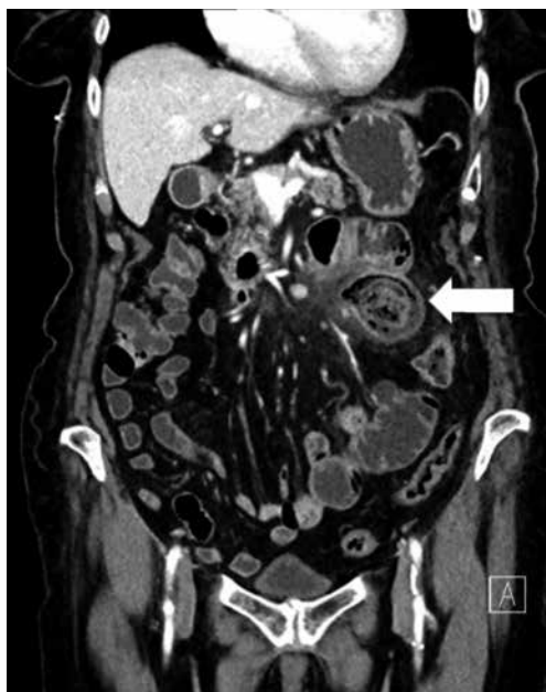
KUVA 1. Aiemman sairaalahoitajakson aikana otetussa TT:ssä näkyy tyhjäsuolen ison umpipussin tulehdus (nuoli).

jossa todettiin ohutsuolitukos. Ohutsuolen sisällä näkyi massa, joka tukki suolen luumenin ja aiheutti tukoksen ( KUVA 2 ). Potilaalle asetettiin nenä-mahaletku, mutta myöhemmin ohutsuolen läpikulkukuvauksessa varjoaine ei edennyt, ja päädyttiin leikkaushoitoon. Leikkauksessa tukoksen syy selvisi. Mikä TT-kuvistakin näkyvä asia aiheutti suolitukoksen? Vastaus on sivulla 367.