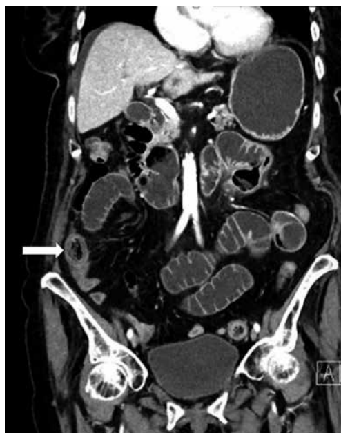
KUVA 2. TT:ssä näkyvät laajentuneet ohutsuolen lenkit ja tukkiva massa (nuoli).