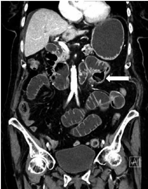
KUVA 3. TT:ssä näkyy tyhjä jejunumin umpipussi (nuoli).

ohutsuoli avattiin ja iso, 3 cm:n kokoinen kova fekaliitti poistettiin ( KUVA 4 ). Jejunumin umpipussi oli aivan Treitzin ligamentin seudussa, eikä siinä ei ollut perforaatiota. Umpipussin päälle ommeltiin isoa vatsapaitaa suojaksi, eikä suolen typistykseen ollut tarvetta. ■