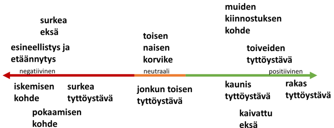
Kuvio 1. Naisten representaatiot negatiivisesta positiiviseen

Käsittelin naisten representointia parisuhteen osapuolina luvussa 4. Naisten representaatioista esille nousi erityisesti naisesta puhuminen ihanana tyttöystävänä. Tyttöystävä nähtiin hyvänä kumppanina, arvokkaana ihmisenä ja rakkaana. Tällöin naisesta puhumiseen liittyi positiivinen suhtautuminen eli affektisuus. Toinen esille nouseva tapa puhua naisista oli naisen näkeminen mahdollisena tai tavoiteltavana kumppanina. Erityisesti naisesta puhuminen mahdollisena tai tavoiteltavana pokana, eli iskemisen kohteena, nousi yleiseksi tavaksi puhua naisesta. Tällöin naisesta puhuttiin esineellistään tai eläintarkoitteisin sanoin, mikä vahvasti kuvaa naisesta kohteena. Naisten representaatiot on havainnollistettu janalla negatiivisesta positiiviseen kuviossa 1.