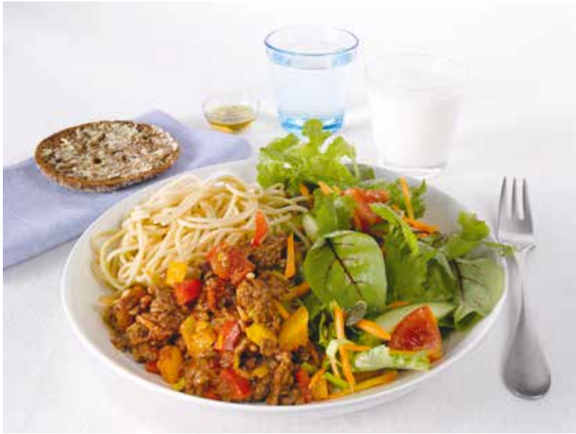
KUVA 2. Urheilijan lautasmallin avulla voidaan havainnollistaa sitä, mistä terveellinen ja tasapainoinen ateria koostuu. Tässä on yksi esimerkki lautasmallista, joka sopii taito- ja tarkkuuslajiuurheilijoille, painoahan pudottaville sekä muille vähän energiaa tarvitseville urheilijoille (33). Yhteistyössä: Suomen Olympiakomitea.

suorituskyvyn parantamisessa: tavoitteena on elimistön tasapainotilan löytäminen.