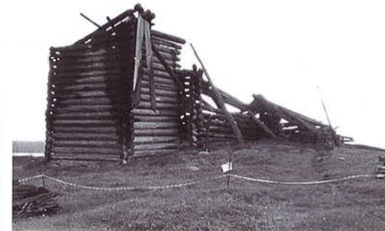
Kontupohjan kirkko tuhopolton jäljiltä elokuussa 2018 / NN