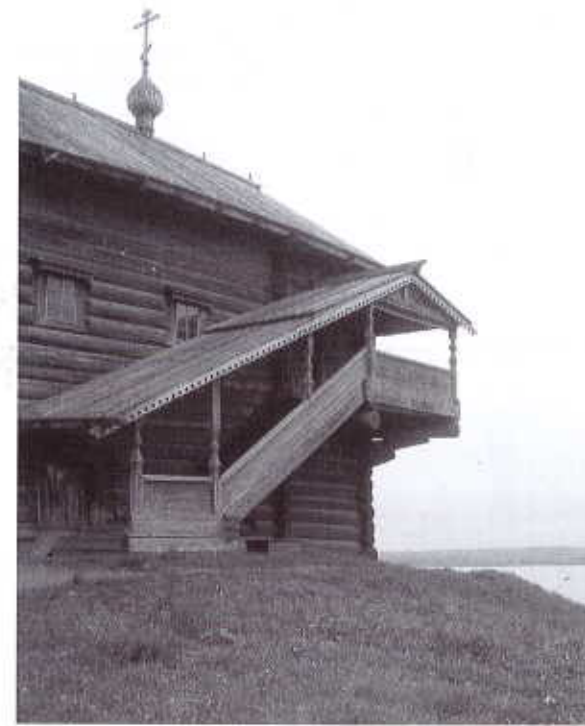
Kirkon pohjoispuoleiset portaat. / valokuva: MMA 1993.