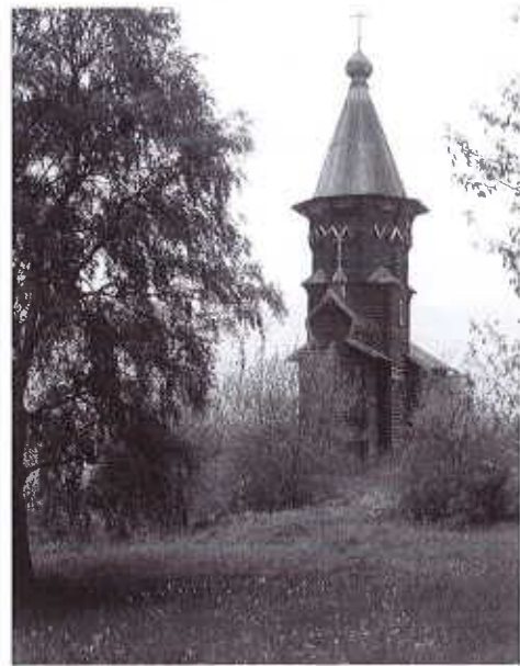
Kontupohjan kirkko.