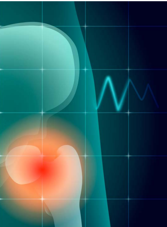
Potilaan tunnistamisen mahdollistavia tietoja on muutettu.

vulias. Miehen hengitys oli riittävä, sillä saturaatio oli hyvä ja keuhkojen auskultaatiotutkimuksen tulos oli symmetrinen. Hengitystapa oli vaivaton ja taajuus normaali. Ennen siirtoa hänelle tiputettiin 100 ml natriumbikarbonaattia ja 1 000 ml Ringerin liuosta. Siirtoon valmistauduttiin tukemalla vasen alaraaja tyhjiöpatjaan.