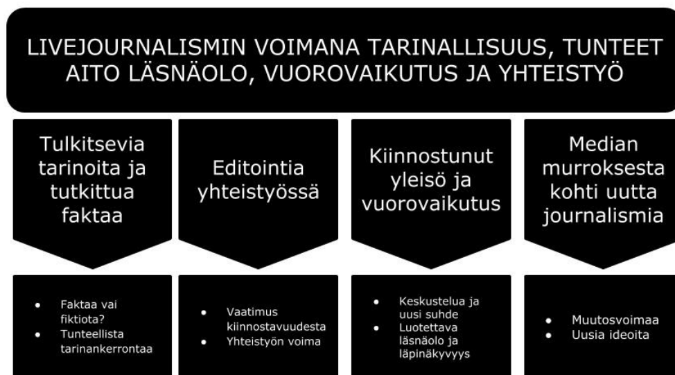
Kuvio 2: Mustan laatikon livejournalismin temaattisen analyysin teemakartta.

Livejournalismin voimana tarinallisuus, tunteet, aito läsnäolo, vuorovaikutus ja yhteistyö -yläteema vastaa siis osaltaan livejournalistien näkökulmasta siihen, millä keinoilla Mustassa laatikossa päästään lähemmäs yleisöä. Tarinallisuudella yläteemassa viitataan siihen, että kaikkia Mustan laatikon esityksiä yhdistää tietynlainen tarina, jossa toimittajat esittävät omakohtaisia mielipiteitä tai kokemuksiaan ja avaavat journalismin taustaprosesseja avoimesti. Tunteet ovat mukana yläteemassa, koska tarinoille on tyypillistä tunteisiin vetoaminen, tapahtui se sitten aihepiiriin tai tunteen ilmaisun kautta. Aito läsnäolo tarkoittaa Mustan laatikon livetilannetta, jossa toimittajat ovat läsnä inhimillisinä ja omina itsenään. Vuorovaikutuksella taas yläteemassa viitataan yleisösuhteeseen, yleisön kanssa syntyvään yhteyteen ja yleisölle tarjottuun mahdollisuuteen antaa palautetta, oli se sitten välittömiä reaktioita teatterisalissa tai keskustelua esityksen jälkeen. Viimeisenä tekijänä yläteemassa oleva yhteistyö tarkoittaa Mustan laatikon työtapoja, joissa keskeisessä asemassa on syvälinen editointi ja aiheeseen perehtyminen sekä tiimityöskentely kollegoiden kanssa. Mustan laatikon yhteistyöllä syntyy toimittajien mukaan parempaa, syvällisempää ja uudenlaista journalismia. Yläteemaan ei noussut teoriassa ja aineistossa korostuneet journalismin läpinäkyvyyden ja subjektiivisuuden voimat, mutta ne tulevat esiin tärkeinä käsitteinä eri pääteemojen ja niiden alateemojen kautta.