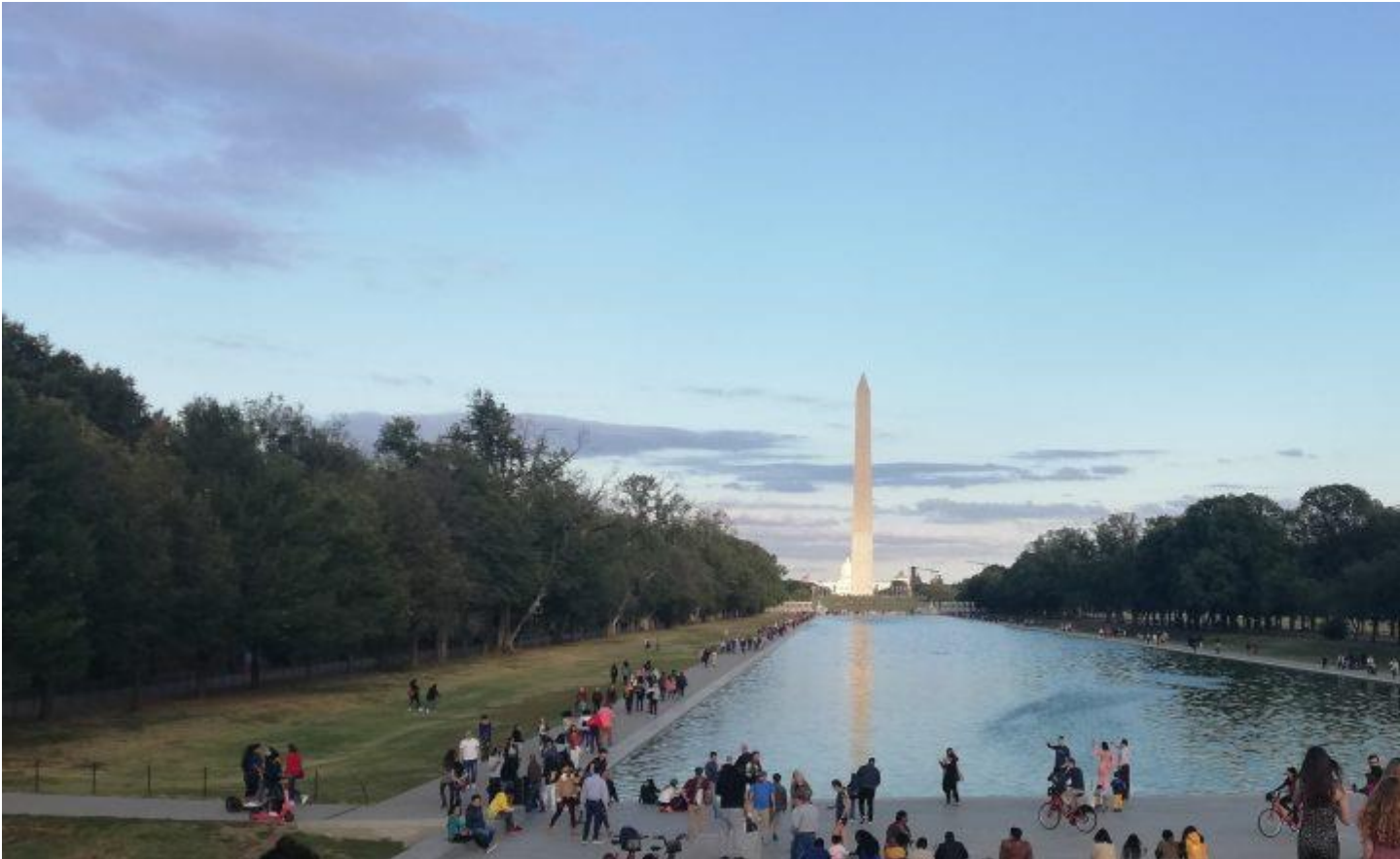
Washington-monumentti National Mallilla.

Orjattaresi -sarjassa avautuu Lincolnin muistomerkiltä näkymä kohti National Mallia , joka paljastaa myös muutoksen Washington-monumentissa. Jättimäiseen obeliskiin on sarjassa lisätty yläosaan poikkisakara, tehden siitä ristin. Pelkkä obeliski luo nykykatsojalle helposti ajatusyhtymän – jälleen kerran – muinaiseen Egyptiin. Se on kuitenkin tuttu näky myös Rooman kävijöille.