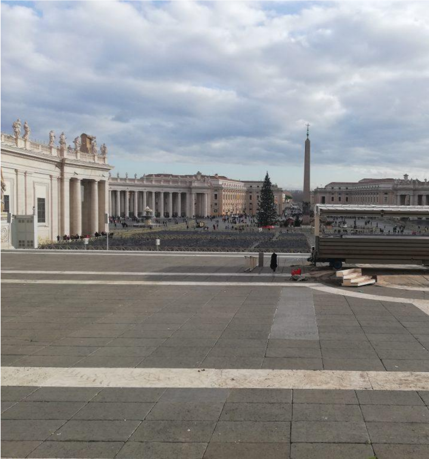
Pietarin kirkon aukio Roomassa sekä obeliski jouluvalmistulujen aikaan.

Obeliski onkin yksi symboleista, jonka merkitys vaihtuu pitkällä perspektiivillä suhteellisen tiheään. Kristillisen Rooman jälkeen se leviää läntisen maailman kaupunkeihin, jossa se uusklassismin myötä muodostuu myös imperialismiin ja kolonialismin merkiksi. Tämä on todennäköisesti vaikuttaa siihen, miksi myös National Mallille on haluttu rakentaa obeliski. Sen avulla uusi kansakunta näyttää kuuluvansa yhdenvertaisena eurooppalaisten esi-isiansä joukkoon.