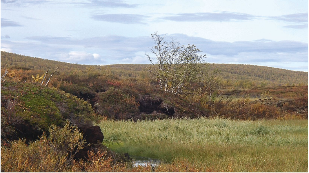
Kuva 2. Termokarstipainanne ja palsan reunaosan romhdustrakenteita.