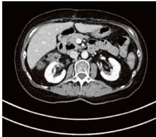
D. TT-kuvauksessa ei ekstrarenaalisia pelviksiä ole.