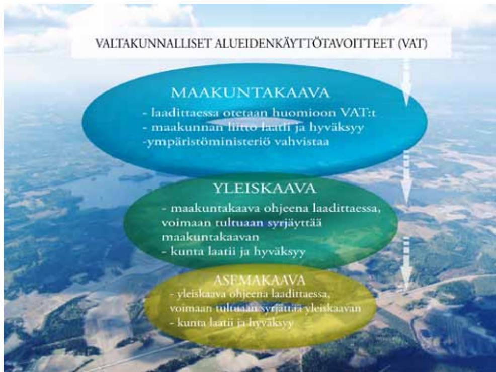
Kuva 1. VAT osana alueidenkäytön suunnittelujärjestelmää.

Valtakunnalliset alueidenkäyttötavoitteet ovat osa maankäyttö- ja rakennuslain (132/1999) mukaista alueidenkäytön suunnittelujärjestelmää (kuva 1). Kyseessä on ohjausväline, jonka avulla valtioneuvoston on tarkoitus linjata alueidenkäyttöä valtakunnallisesti merkittävissä asioissa.