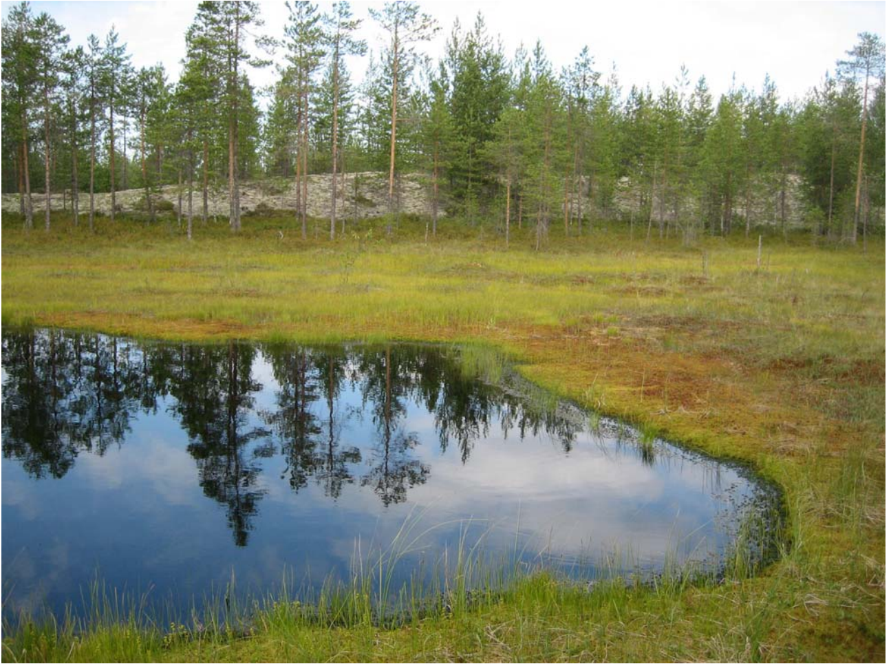
TUU-08-053 Multisärkkä. Pieni jäkälän peittämä paraabelidyyni suon laidalla alueen keskiosassa.