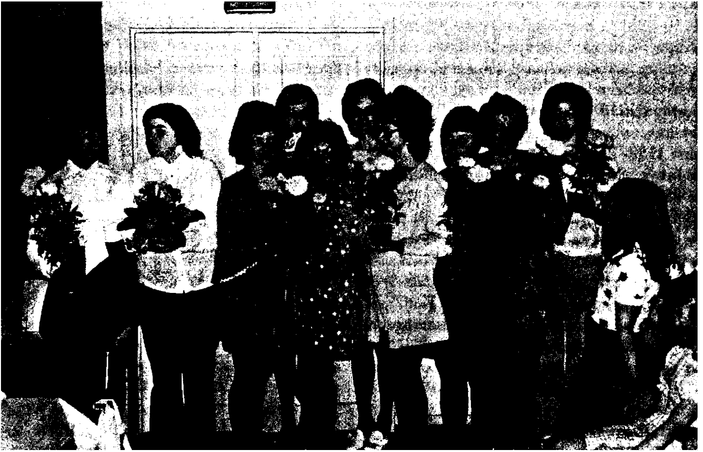
Virsbons Suomi-seuran järjestämä äitienpäiväjuhla Folkets Husissa 12.5.1974.