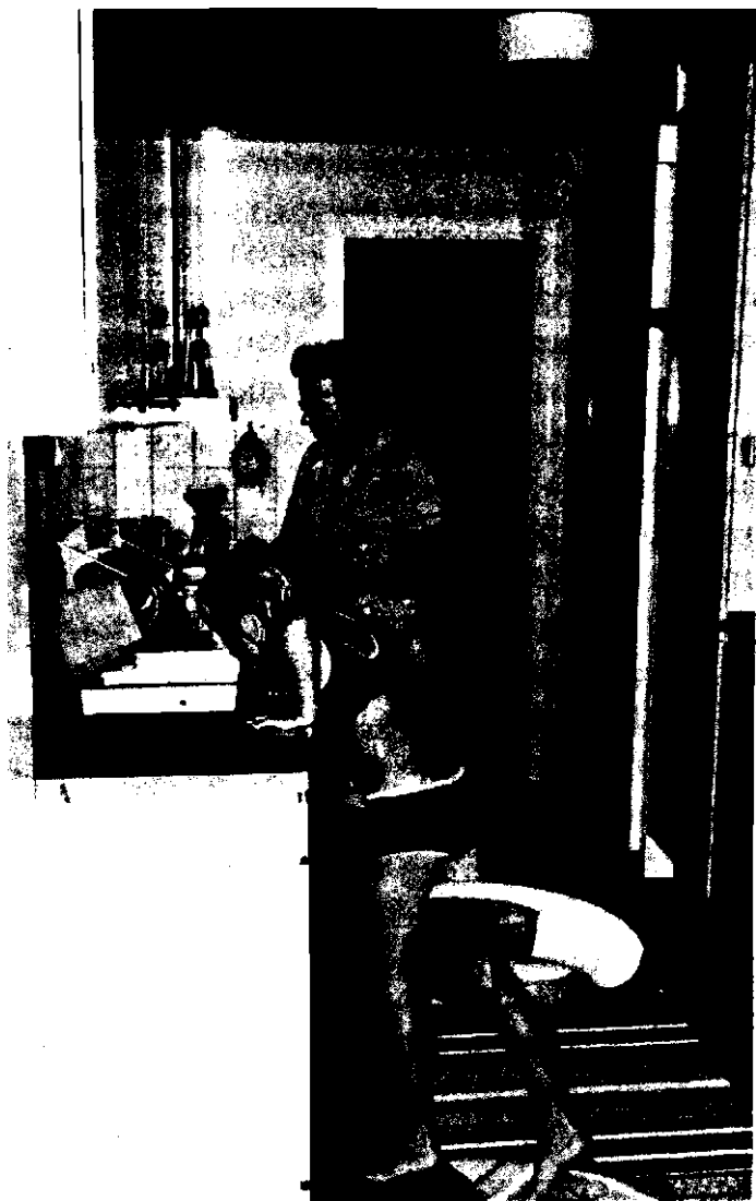
Äiti ja tytär virsbolaisen omakotitalon keittiössä. Monelle ruotsinsuomalaiselle muutto Ruotsiin toi mukanaan paremman asunnon.