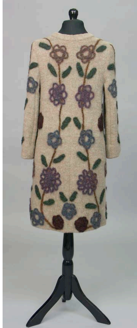
Kuva 2. Flower Power, 1967. Näytökseen suunniteltu takki koneella neulottua vanutettua villaa. Virkatut applikaatiot Margareta Kuntzi. Neulottua-Stickat Ulla Bergh.

Kun asiakas käyttää sanaa "taikuus", hän tiivistää sitä palvelun ja vaateen laadun kokemusta, jossa neulomisen taitoa ja makutaitoa on käytetty materiaaleihin ja hänelle on tuotu nähtäväksi täsmälleen hänelle sopivia tuttuja tai aivan uusia neulepinta- ja värikokeiluja useina muunnelmina, joita hetkeä aikaisemmin ei vielä ollut olemassakaan.