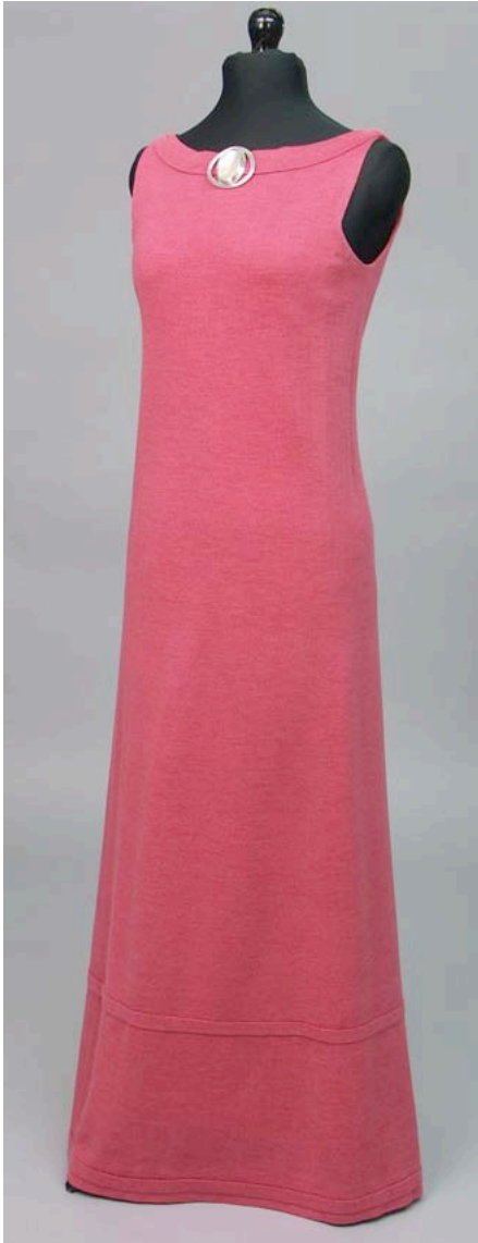
Kuva 1. Asiakkaalle suunniteltu koneella neulottu iltapuku, 1964. Joka toinen kerros villaa, joka toinen synteettistä "kristallilankaa". Neulottua-Stickat Ulla Bergh. Koru Birgitta Bergh.