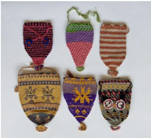
Kuva 1. Pieniä laukkuja Turkista.

Käsin tehdyssä ainutlaatuisuudessa on kyse ihmissuhteista ja aitoudesta. Kaikkein myönteisin käsityötuotteeseen liittyvä mielleyhtymä on se, että tuote on tehty henkilökohtaisesti käyttäjälle. Richard Sennettin (2006, 194) mukaan käsityöläisyydessä on kyse jonkin asian itseisarvoisesta hyvin tekemisestä. Tämä tuottaa lisäarvoa sekä valmistajalle että käyttäjälle. Käsityötuotteen lisäarvo on syntynyt tekijän kyvystä valmistaa erinomaisia tuotteita. Taustalla vaikuttaa käsityön tekijän arvopohja ja hänen mielikuvuksensa, luovuutensa, tekemisen taitonsa, materiaaliensaamisensa, tarinat ja ihmissuhteet.