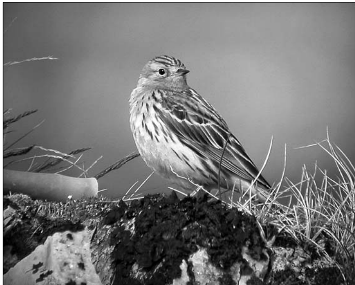
Lapinkirvinen mulloksella.

2005: Muutonseurantaa Lie Pan- kakoskella 23.7.–11.9. 20 päivänä yhteensä 306 m, parhaina päivinä 11.8. 22 m, 19.8. 29 m, 25.8. 37 m ja 31.8. 34 m (PT). Muualta parhaat summaukset: 22.8. Rää Kylmäpohja 90 p, 23.8. Toh Valkeasuo 150 p, 24.8. Pyh Mulon pellot n. 200 p (JaV), Kit Puhos 125 p (KJä), 25.8.