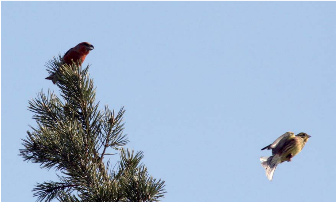
Isokäpylintu on ajanut keltasirkun pois männynlatvasta.

lintukirjat, kiikarit, kaukoputket, jalustat, äänitteet asiantuntemuksella