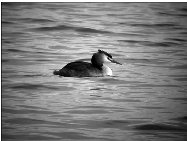
Silkkiuikku on joskus myöhäinen muuttaja.

2005: Jälleen hyvä koskelosyksy, vaikka edellisen syksyn ennätysmäärästä jäätiinkin. Kerääntymistä syyskuun lopulta lähtien. Kertymiä ja muuttoa: 30.9. Kit Puhos 1300 p, 6.10. Rää Haapasalmi Pantunniemi 1000 p (MH), Kit Ätäskö 19.10. n. 1000 p (PRa, RSi), 20.10. n. 800 p (AP), Rää Vuoniemi 24.10. 128 m, 27.10. 292 m (JaV, ANy), 28.10. Out Vekarusniemi 500 p (LV), 29.10. Kes Pellavasniemi 600 p (PH), 1.11. Rää Pieni-Onkamo 550 p (HKa), Kes Ylä-Kousa 550 p (PH), Rää Suuri-Onkamo 9.11. n. 2100 p, 12.11. n. 2500 p (JaV), 18.11. Out Vekarusniemi 1100 p (LV), 19.11. Kit Suoparsaari 1500 p (KA), Rää Suuri-Onkamo 20.11. 2000 p ja 1.12. 1000 p (JaV). Syksyn yhteismäärä n.