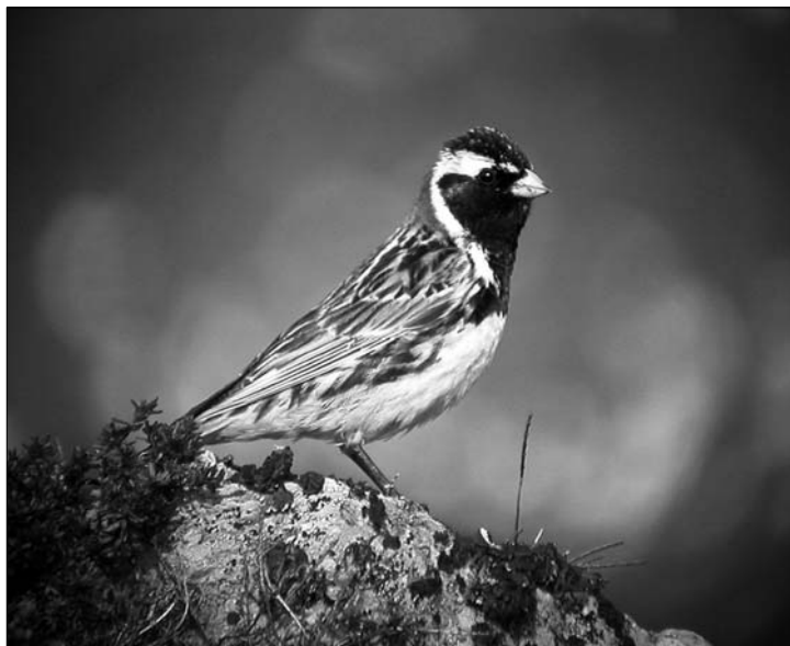
Lapinsirkku on säännöllinen läpimuuttaja myös syksyisin.

2005: Syksyn ensimmäinen 17.9. Joe Noljaikka Suisto 1 m (AL). Edellissyksy runsaampi, havaintoja n. 292 yksilöstä. Eniten: 22.10. Juu Paalasmaa a28 S, 24.10. Eno Saarenpää 43 m, Eno Ahvenlahti a50 p (HKa) ja 5.11. Toh Nikuvaara 35 p (TE). Viimeinen 19.11. Joe Marjala 1 m (UP). Juuassa joulukuulta kaksi havaintoa ilmeisesti talvehtivasta pulmusesta (HL).