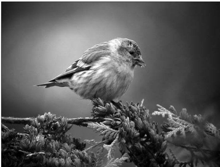
Vihervarpusia summataan syksyisin useita tuhansia yksilöitä.

Varsinkin Kit Asikko imuroi paljon vihervarpusia: 18.9. 1240 m (MH, PRa, RSi), 22.9. 1730 m (MH), 24.9. 2100 m (MH), 25.9. 850 S (MH, KJä) ja 27.9. 1250 S (MH). Muualta 17.9. Kit Kyyrönniemi 458 NNW-NW (PRa, RSi), 19.9. Kit Kyyrönniemi 522 p/m (MH), 20.9. Rää Haapasalmi 800 m + kiert (MH) ja Rää Vuoniemi 177 SE (JaV), 22.9. Joe Noljaikka Suisto 192 m (LV) sekä 30.9. Rää Vuoniemi 235 SE (JaV, HKa). Viimeiset 25.11. Joe Linnunlahti 4 p/kiert (HKo) ja Kit Pajarimäki 1 W (KJä).