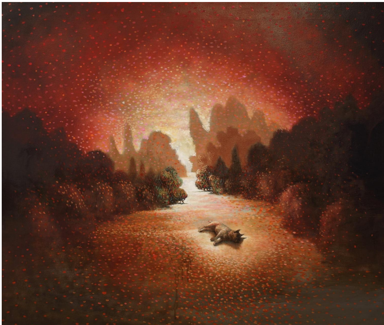
Liite 2. Samuli Heimonen: Maailmojen välissä , 2013. ©Samuli Heimonen