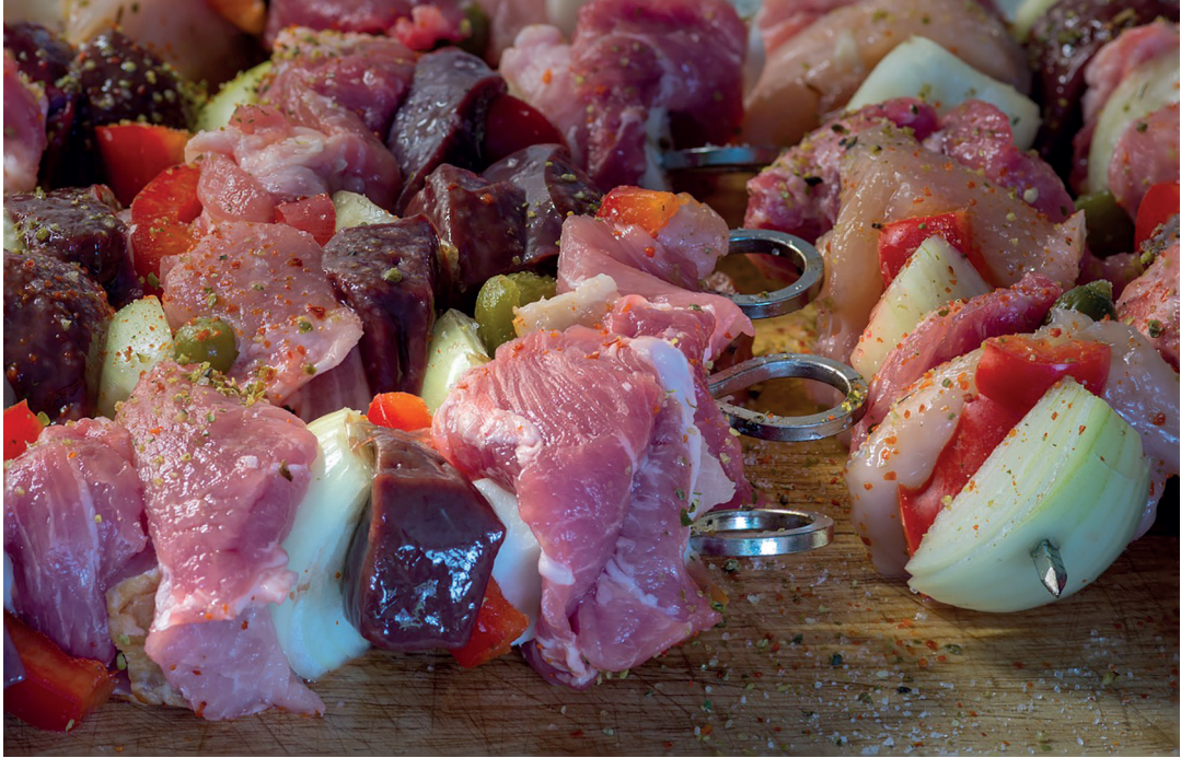
Kuva 3. Campylobakteerit säilyvät hyvin erityisesti siipikarjan lihassa ja sisäelimissä. Infektioiden torjumiseksi keskeistä on elintarvikkeiden perusteellinen kypsennys ja ristikontaminaatioiden välttäminen esimerkiksi käsien, leikkuulautojen ja muiden työvälineiden välityksellä raa'asta lihasta sellaisenaan syötäviin tuotteisiin.