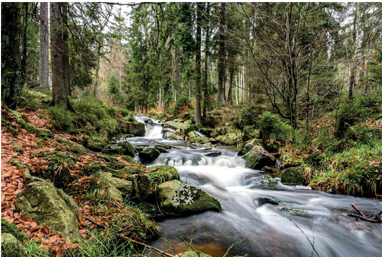
Kuva 4. Kamylobakteeri on yleinen löydös myös desinfiomattomissa pintavesissä. Vaelluksilla ja retkeittäessä pintavesi onkin tärkeää keittää tai käsitellä muutoin ennen juomista, vaikka se vaikuttaisikin silmämääräisesti puhtaalta.

Suomessa kamylobakteriosoin ilmaantuvuus laski rajusti covid-19-pandemian seurauksena ja on pysynyt alhaisemmalla tasolla siitä saakka. Tämän ilmiön taustalla