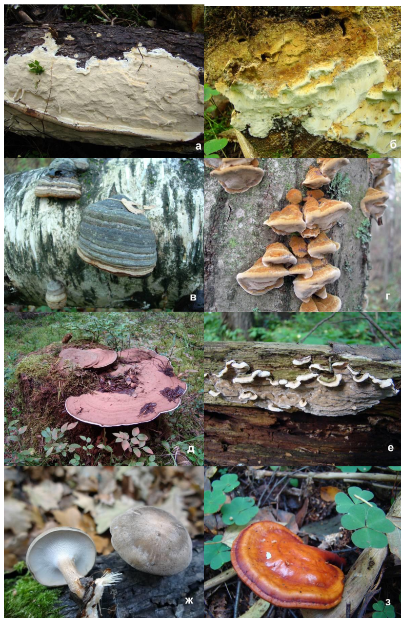
Рис. 2. Различные формы плодовых тел трутовых грибов: а — распростертое ( Perenniporia subacida ), б — распростертое с ложными шляпками ( Antrodia sitchensis ); в-з — плодовые тела со шляпками: в — копытообразные ( Fomes fomentarius ), г — черепитчато расположенные ( Inonotus radiatus ), д — уплощенные ( Ganoderma applanatum ), е — распростерто-отогнутые ( Skeletocutis carneogrisea ), ж-з — с ножкой: ж — с центральной ножкой ( Polyporus brumalis ), з — с боковой ножкой ( Ganoderma lucidum ).