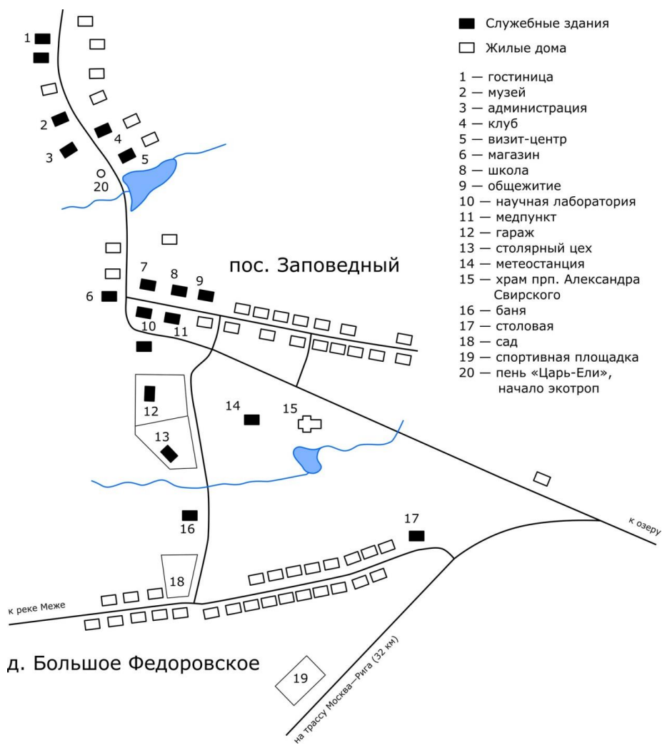
Рис. 8. Схема центральной усадьбы заповедника.