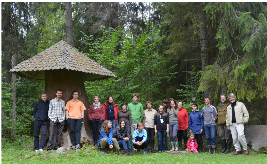
Рис. 7. Участники международного курса «Лесное биоразнообразие и экосистемы Финляндии и России: экология и таксономия ксилобийных базидиальных грибов».