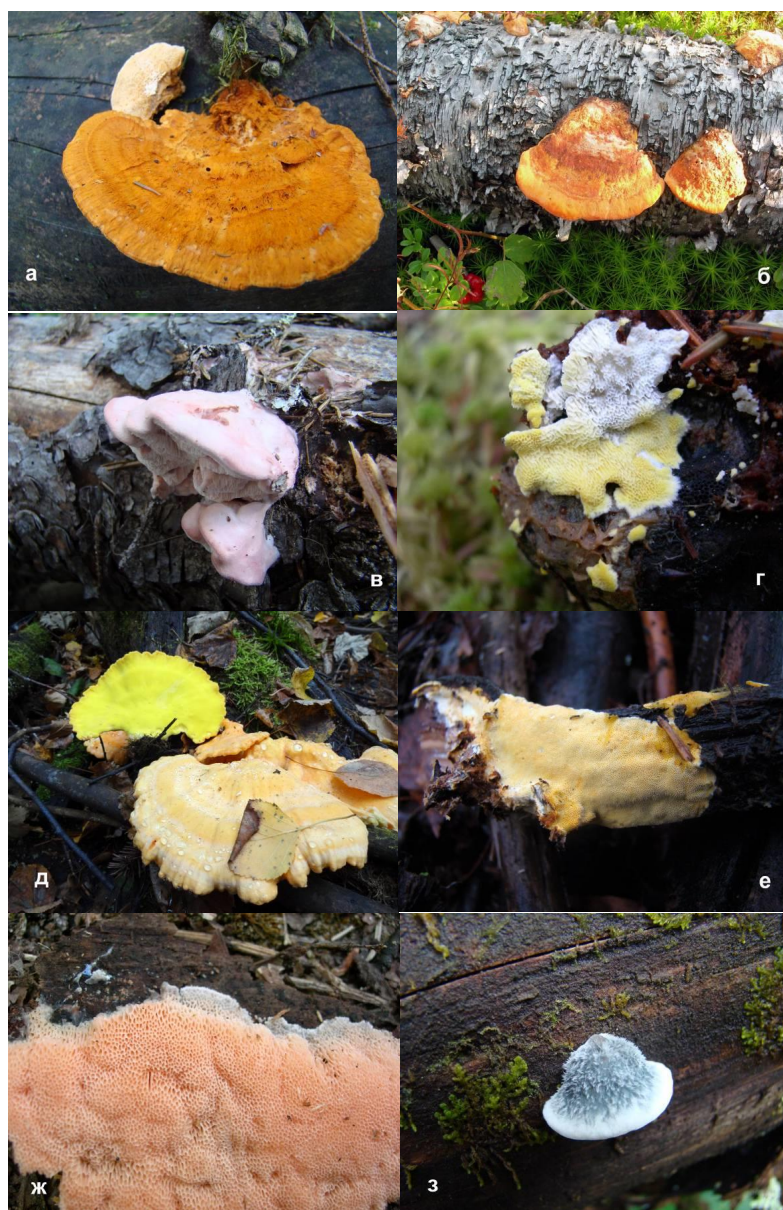
Рис. 4. Ярко окрашенные плодовые тела некоторых трутовых грибов: а – Pycnoporellus fulgens , б – Pycnoporus cinnabarinus , в – Leptoporus mollis , г – Antrodiella citrinella , д – Laetiporus sulphureus , е – Perenniporia tenuis , ж – Rhodonia placenta , з – Postia caesia .