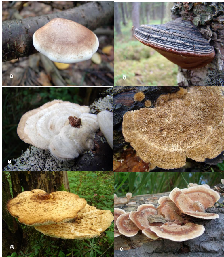
Рис. 6. Верхняя поверхность шляпки плодового тела трутовых грибов: а — с тонкой кожицей ( Piptoporus betulinus ), б — растрескивающаяся ( Phellinus nigricans ), в, г — щетинистой ( Trametes hirsuta , Trametella trogii ), д — с чешуйками ( Polyporus squamosus ), е — с разноцветными зонами ( Trametes ochracea ).