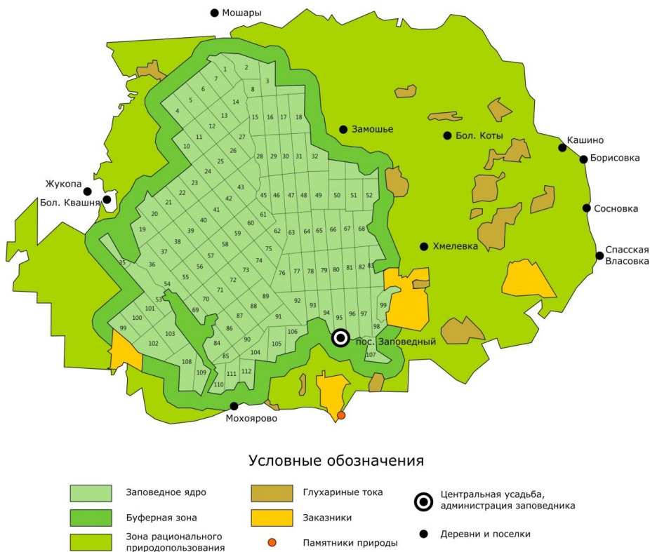
Рис. 1. Схема территории заповедника с разбивкой на кварталы.

По геоморфологическому строению территория заповедника представляет типичный моренный ландшафт Верхневолжского региона, слабо всхолмленную равнину с абсолютными отметками 220–280 м над ур. м. По геологическому строению – это структурная часть древнего плато, сложенного серпуховскими известняками нижнего карбона ( http://oopt.info/tsenles/index.html ).