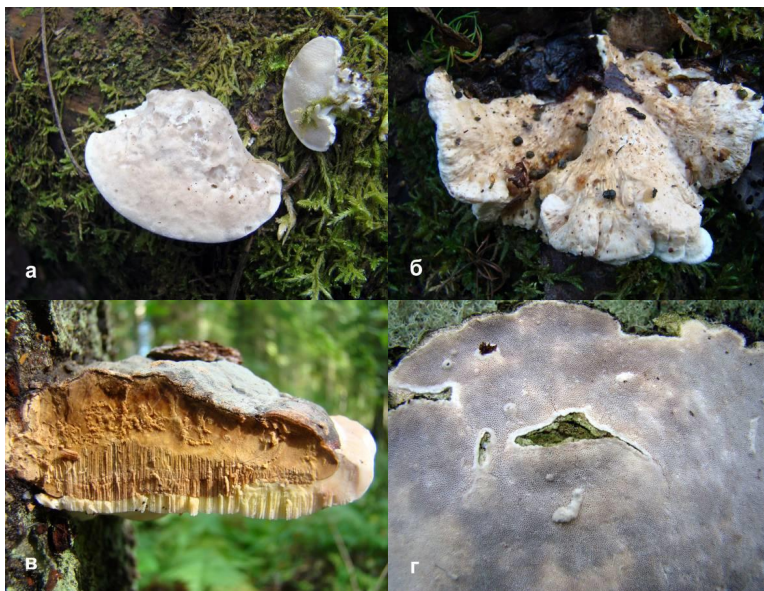
Рис. 3. Плодовые тела трутовых грибов: а — с ровным краем ( Postia tephroleuca ), б — с волнистым краем ( Spongiporus undosus ), в — многолетние с тупым краем и слоистым гименофором (поперечный срез Fomitopsis pinicola ), г — распростертые со стерильным краем ( Cinereomyces lindbladii ).