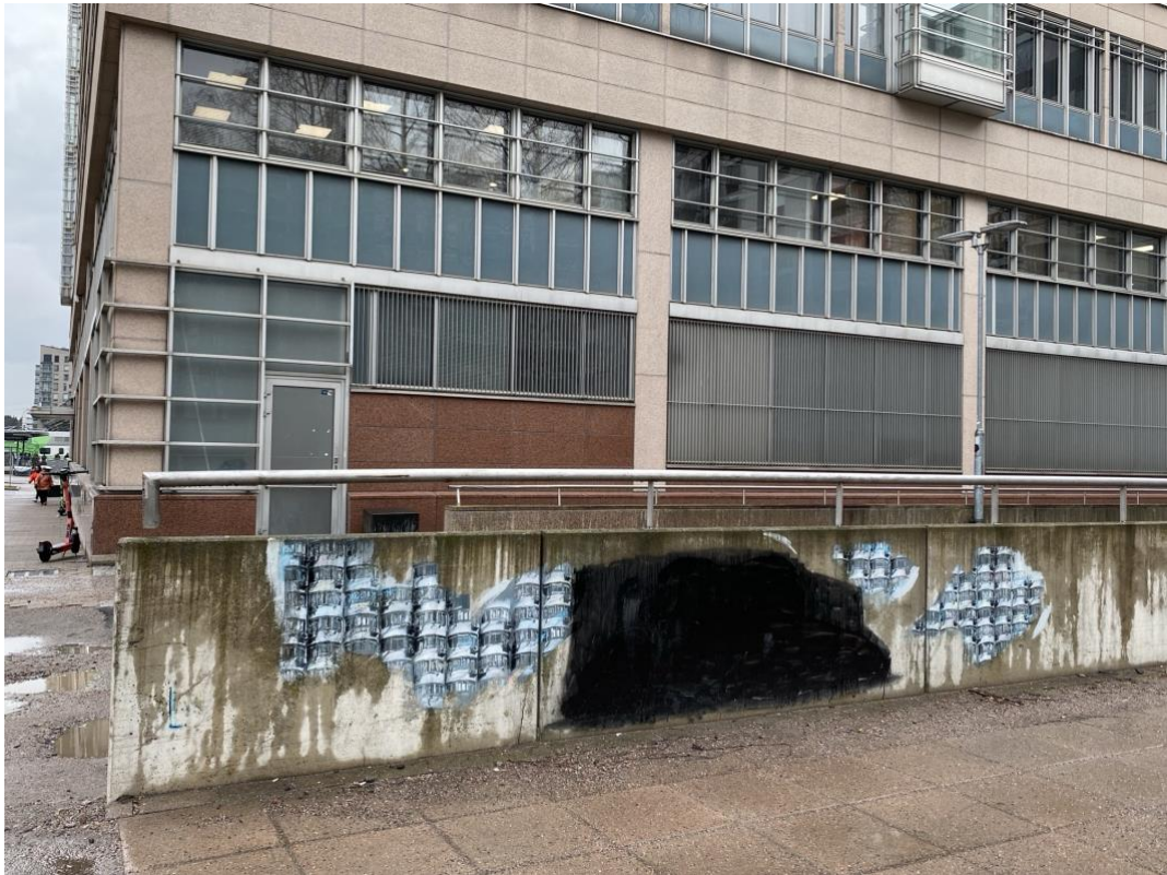
Kuva 5. Piiloon maalattu teos, joka esitti nukkuvaa naista.

Toisaalta osa haastateltavista myös toivoi teoksiin lisää vaihtuvuutta niiden määrän lisäämisen sijaan. Tähän liittyi sekä ajatus katutaiteen luonteesta jonain väliaikaisena että toisaalta osan haastateltavista mielipide siitä, että teoksia oli jo tarpeeksi tai jopa liikaa. Teosten vaihtuvuus yhdistettiin yllättävyyteen, mikä teoksiin kiintymisestä huolimatta nähtiin katutaiteelle ominaiseksi.