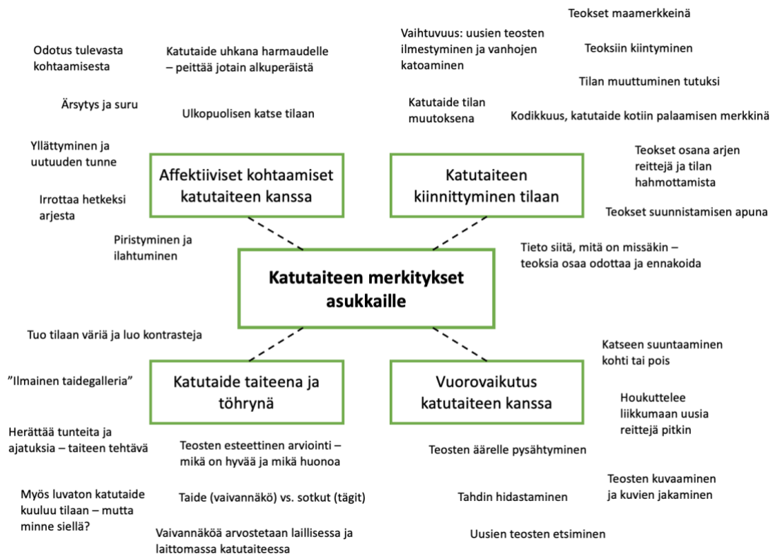
Kuva 6. Käsittekartta katutaiteen merkityksistä haastatelluille asukkaille.

Haastateltavien kertomuksissa katutaiteen vaikutukset ja sille annetut merkitykset näkyivät moninaisina ja usein haastavina sanoittain, mutta samalla selkeästi läsnä olevina. Haastattelujen pohjalta koostamassani käsittekartassa (kuva 6) olen pyrkinyt