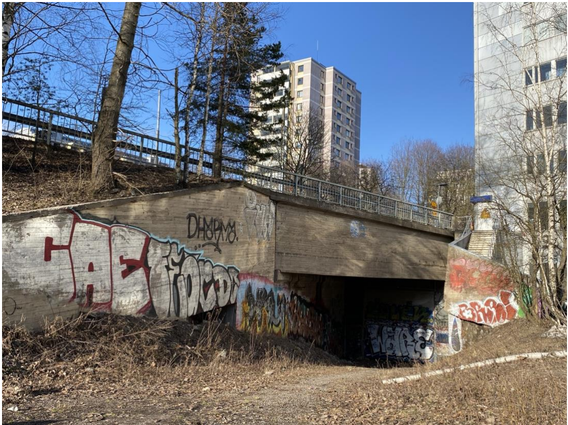
Kuva 3. Graffiteja ja tägejä Itä-Pasilan reunalla olevan suljetun rautatietunnelin suulla.

H4: No kyl se vaikuttaa, että, emmä tiää, mä jotenki, kaikki ihmiset jotka on heti kieltämässä graffitit, nii ei ei ei. Mä oon aina niiden kaa ihan eri mieltä. Et ei tietenkään sellasta niinku että joku tägi sun oman kodin seinään, et ei sellasta, mut niinku et oikeesti tarjotkaa tilaa sille taiteelle, niin sit siit tulee tällasta, et siit tulee tosi hienoo, niin jotenki silleen että, et tää oli kutsuva, koska nää on antanu tilaa just sille, että on taidetta ja on kaikkee.