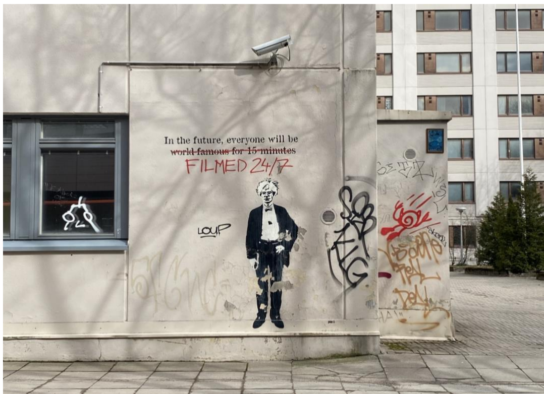
Kuva 2. Kantaottava katutaide ja tägejä.

H6: Mä tykkään silleen et jos on jotain sellasii et vähän ottaa kantaa johonki vaik vähän niinku yhteiskunnalliseen teemaan tai tällaseen. Nii nii, niist mä niinku tykkään eniten, et jos ne niinku oikeesti pistää sut mieltii. Ja sit etenki jos on jotain sellaisia et mist sä et oo ensinäkemältä tajunnu sitä viel, ja sit vast kun sä oot niinku kävelly siitä ohi puol vuotta ja sit sä oot siellee ahaa, nii joo, et täs on tällanen piilomerkitys. Nii mun mielest se on aina jotenki ihan parast.