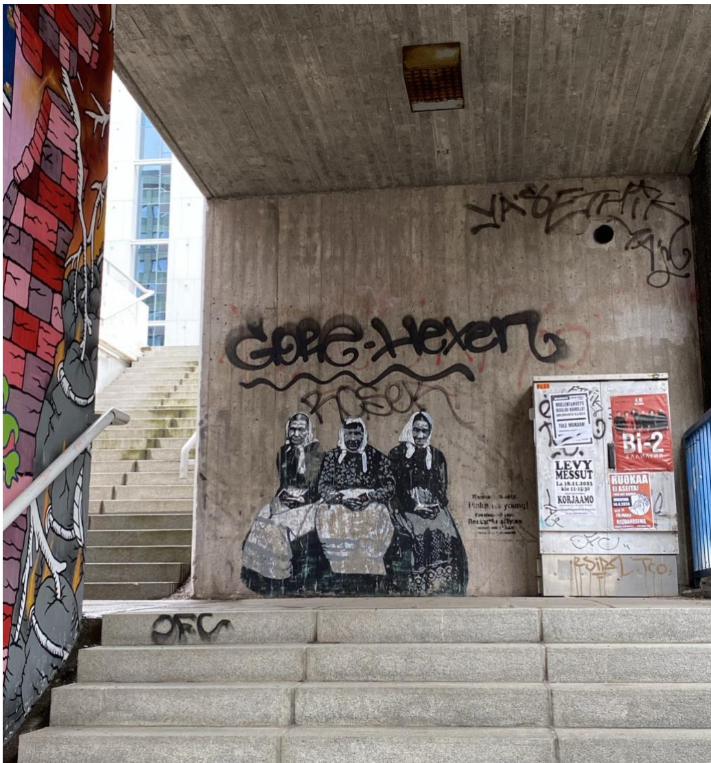
Kuva 4. Mummoaiheinen katutaide-teos kerrosten välisessä portaikossa.

H4: Aa, no meille itse asiassa näkyy kyl, siin on niinku, meidän pihalla ei sinänsä oo, mut siinä meidän ihan pihan takana. Me etittiin ekana päivänä jätetuonetta, niin tota, me käytiin kaikki se piha-alue läpi, ja siel oli sillee niinku että portin takana oli ihan kunnan semmonen graffitiseinä, ja se, olik se tehty 2020, siihen oli viel spreijattu, ja tosi hienoi teoksia ja me oltiin ihan sillee vau, että me täällä vaan etitää, että mihin roskat voi viedä, ja sit täältä tulee tämmöstä taidetta yhtäkkiä. Ja tota, niin se näkyy niinku periaatteessa meidän ikkunasta, ja sitte kans siinä niinkun, öö, vielä seuraavan talon pihalla, niin niillä on siellä joku semmonen alikulku ja sieltä näkyy kans graffitiseinää taustalla. Niin et kyl se niinku näkyy myös sielt ikkunasta, et se on vähän semmonen et tule, tule etsimään ja tutkimaan!