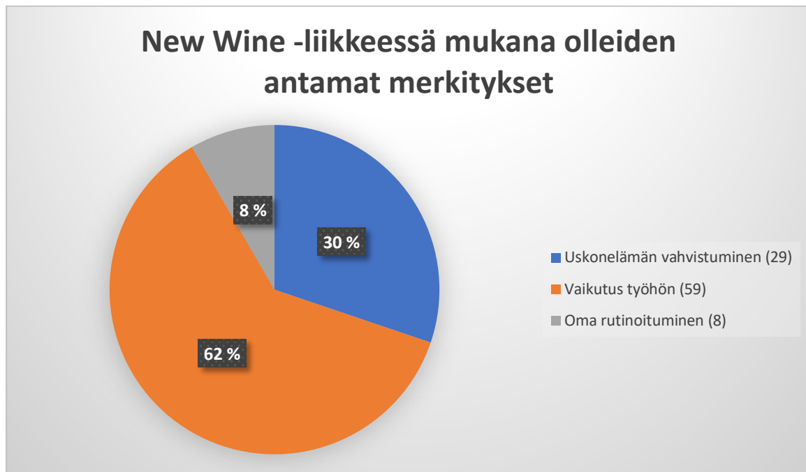
Kaavio 2. Pääluokat tutkimuskysymyksessä, millaisia merkityksiä New Wine -liikkeellä on ollut aktiivisesti mukana olleiden elämässä?

Toisen tutkimuskysymyksen kautta ilmenivät nämä kolme pääluokkaa: uskonelämän vahvistuminen, vaikutus työhön ja oma rutinoituminen. Kaksi ensimmäistä keräsivät suuren enemmistön alkuperäisten ilmausten määrästä. Tämän perusteella voitaneen sanoa, että Suomen New Wine on onnistunut haastateltavien kohdalla hyvin tavoitteessaan, kun se on kouluttanut karismaattisen uudistuksen ja armolahjojen käytön soveltamista omaan työhön käytännön seurakuntaelämässä ja omassa uskonelämässä. Liikkeen vähäiseksi koettu rutinoituminen heijastunee omakohtaisesti koetun rutinoitumisen vähäisyyteen.