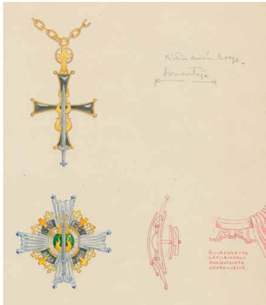
Kalevan Miekan ritarikunnan I luokan komentajamerkki sotilaspapista varten.