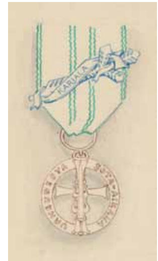
Kalevan Miekan mitali.