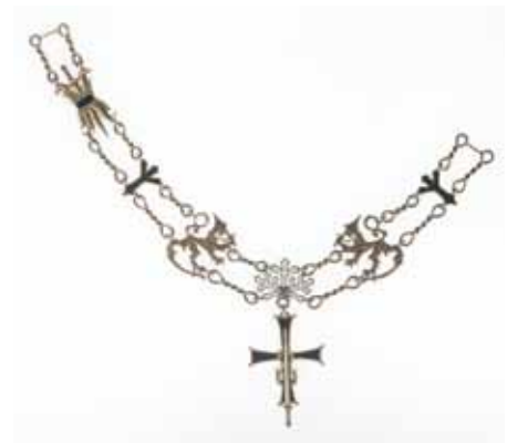
Prototyyppi Kalevan Miekan ritarikunnan suurrististä ketjuineen on esillä Turun linnan pysyvässä kunniamerkkinäyttelyssä.