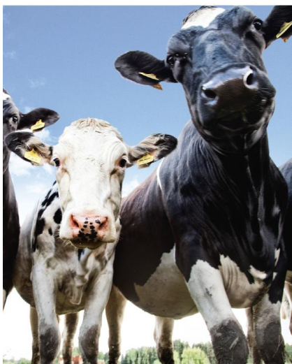
Figur 3 Bilden från texten "Smälter i munnen" ( Samarbete 3/2016: 17 ) 2 .

Bilden i figur 3 skapar en version av verkligheten och innehåller vissa betydelsepotentialer knutna till hur bildens betraktare kan interagera med de representerade korna. Om korna hade fotograferats inomhus skulle bilden representera en annan version av verkligheten. Genom att välja en kort distans, underifrån- och framifrån-perspektiv har fotografen skapat en bild där makt tillskrivs de representerade korna och där djuren söker kontakt med betraktaren (om representation av interaktion se Kress & van Leeuwen 2006: 114 ff.). Genom att välja en annan distans och ett annat perspektiv hade man erbjudit betraktaren en annan position och på det sättet en annan typ av relation till de representerade djuren.