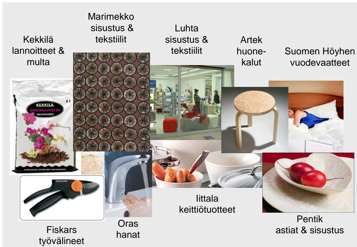
Kuva 2. Kodin ympärille rakentunut klusteri – kollaasi suomalaisyrityksistä.

Taulukossa 8 on esitelty kodin ympärille rakentuneen vapaa-ajan klusteriin tavaroita valmistavia suomalaisyrityksiä. Kotiin liittyvää suomalaista yritystoimintaa löytyy sekä keittiöön ja kodin sisustamiseen liittyvää että pihaan ja puutarhaan liittyvää. Taulukkoon on valittu sellaisia yrityksiä, joiden yritysviestinnästä tai mainonnasta on tunnistettavissa kuluttajalähtöisyys, nautinnot tai elämyksellisyys. Yrityksiä liiketoimintaideoihin on kirjattu vuosikertomuksissa tai markkinoinnissa esitetyjä liiketoiminnan kuvauksia ja mainonnan sisältöjä. Yritykset painottavat markkinoinnissaan eri asioita. Liiketoiminnan ja yritysten visioista on löydettävissä elämäntyyliä ja trendit (esim. Iittala, Marimekko, Tikkurila ja Oras), käyttäjälähtöisyys ja asiakkaan kuuntelu (esim. Fiblon ja Ido), paikallisuus ja historia (esim. Fiskars, Suomen Höyhen, Muurame ja Bohnäs) sekä design ja teknologia (esim. L-fashion group, Suomen Höyhen, Oras ja Iittala).