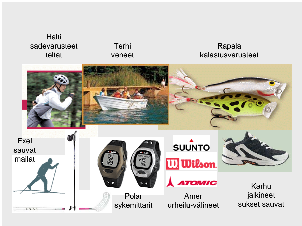
Kuva 3. Urheilun ja ulkoilun ympärille rakentunut klusteri – kollaasi suomalaisyrityksistä.

Taulukossa 9 on esitelty liikunnan ja urheilun ympärille rakentuneen vapaa-ajan klusteriin tavaroita valmistavia suomalaisyrityksiä. Myös liikunnan ja urheilun klusteriin on valittu sellaisia yrityksiä, joiden yritysviestinnästä tai mainonnasta on tunnistettavissa kuluttajalähtöisyys, nautinnot tai elämyksellisyys. Yrityksiä liiketoimintaideoihin on kirjattu vuosikertomuksissa tai markkinoinnissa esitetyjä liiketoimintaideoita. Yritysten kokoa kuvaa vuoden 2003 liikevaihto ja henkilöstön määrä. Lisäksi taulukkoon on kerätty tiedot myynnin jakautumisesta kotimaan ja ulkomaan kesken. Muuta-sarakkeessa on tietoja yrityksen omistuksesta, strategisista linjauksista, patenteista yms. Taulukon lopussa tunnistetun klusterin laajuutta on verrattu ensiksi urheilukaupan myyntiin ja toiseksi kenkäteollisuuden toimialaan.