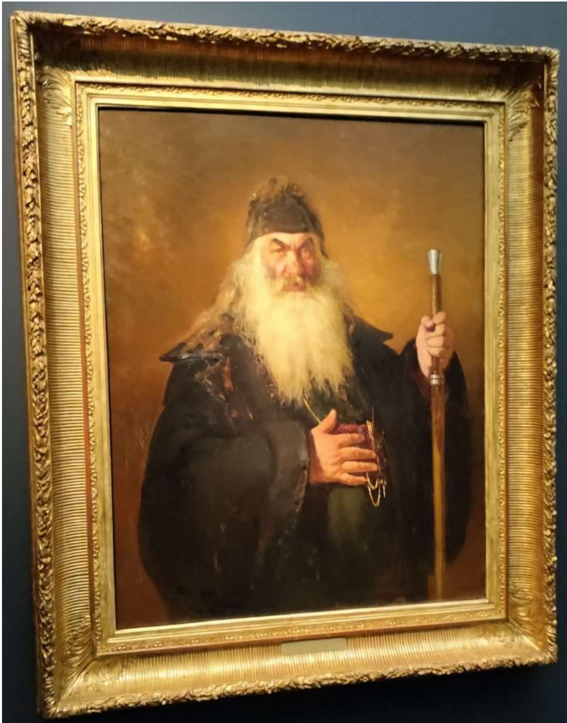
Ilja Repin: Arkkidiakoni (1877).