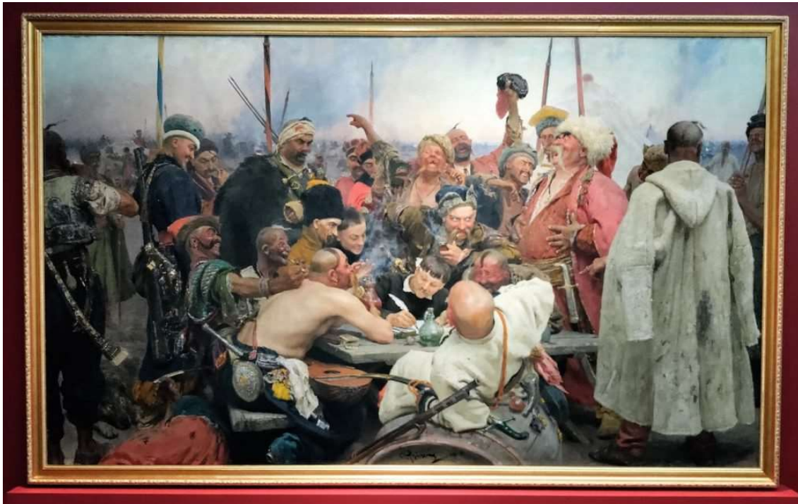
Ilja Repin: Zaporogit kirjoittamassa pilkkakirjettä Turkin sulttaanille (1881-1883).