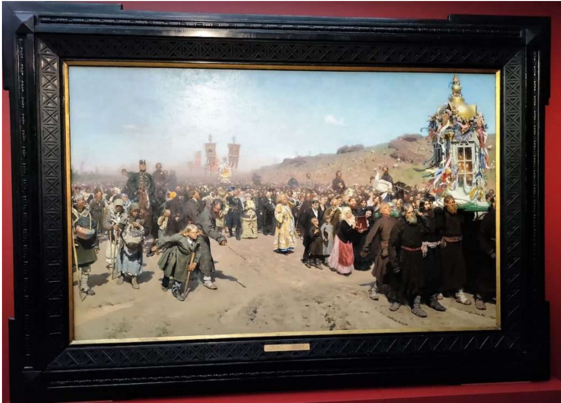
Ilja Repin: Ristisaatto Kurskin kuvernementissa (1881-1883).

tulevaa – tai ehkä ei niinkään tulevaa, vaan kuvata sitä, mikä teki vallankumouksesta ja neuvostovallasta mahdollisen.