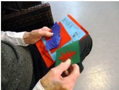
Kuva 5. Asukas katselee saamia joulukortteja.

jossa muutamia asukkaita oli viettämässä aikaa. Keskityin havainnoimaan lähinnä siellä. Vierailu kesti noin 20 minuuttia.