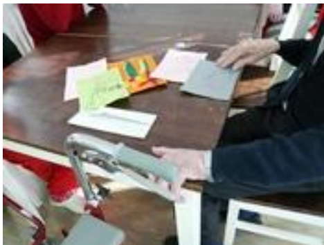
Kuva 3. Asukkaat katselevat saamiaan ystävänpäiväkortteja.

suuntiinsa. Myöhemmin paikalle tulleille asukkaille esiteltiin kortteja ja hoitajat kiinnittelivät niitä hoivakodin seinille.