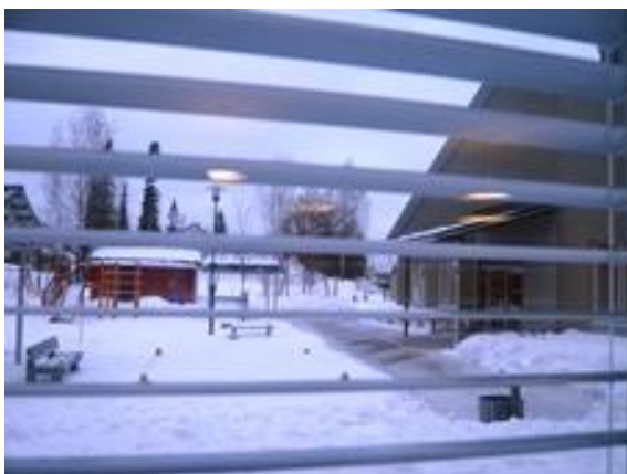
Kuva 4. Jasmiinin yhteistä pihaa, jossa pidettiin laskiaisrieha.

Laskiaistiistaina asukkaat oli kutsuttu päiväkodin ja hoivakodin yhteiseen pihatapahtumaan. Lapset laskivat pulkilla päiväkodin pihan suurista lumikasoista alas. Paikalle oli tuotu radio, josta soitettiin musiikkia. Tapahtuma ei mennyt ihan suunnitelmien mukaan, koska juuri silloin sairastelun vuoksi monia päiväkodin hoitajia ja lapsia oli poissa eikä esimerkiksi tarjoiluja pystytty järjestämään. Asukkaat tuotiin pihalle katsomaan lasten mäenlaskemista. Kuva 4 havainnollistaa pihaa yhteisenä tilana ja sitä, mitä vanhusasukkaat näkevät hoivakodin ikkunoista.