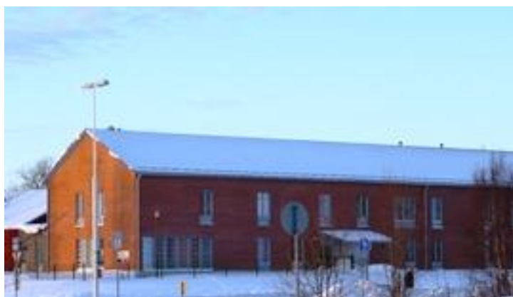
Kuva 1. Jasmiinin hoivakoti v. 2010.

Jasmiinin hoivakoti tarjoaa hoivaa ja asumista ympärivuorokautisesti muistisairauksia sairastaville ja paljon päivittäistä apua tarvitseville ikääntyneille. Hoivakodissa oli hainnointijakson aikana 19–21 asukasta. Yhteisiä tiloja ovat ruokailu-oleskelutilat, jota kutsun keittiötilaksi, kaksi TV-tilaa ja saunatilat (ks. pohjapiirrokset liitteet 5 ja 6). Hoivakodilla ja päiväkodilla on aidatut, mutta yhdistettävät piha-alueet. Hoitajina toimii lähihoitajia, sairaanhoitajia ja kodinhoitajia sekä välillä harjoitteluaan suorittavia opiskelijoita. Nimitän heitä yleistyneen käytännön mukaan hoitajiksi tai työntekijöiksi, koska asukkaille itselleen ei ammattinimikkeillä ole juurikaan merkitystä. Lääkärin lisäksi yksikössä käyvät jalkahoitaja ja kampaaja, musiikkiterapeutti sekä kirjaston ja seurakunnan työntekijöitä. Tammikuussa 2011 hoivakodissa käynnistyi vapaaehtoistoiminta. Vapaaehtoiset vierailevat hoivakodissa esimerkiksi juttelemassa ja ulkoilemassa asukkaiden kanssa. Kuvassa 1 näkyy hoivakoti ulkoa.