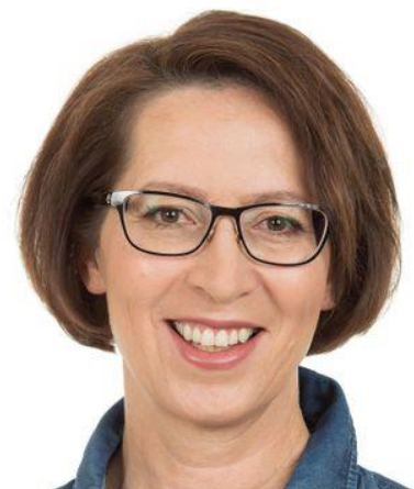
Kuva 7: Sari Essayah