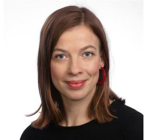
Kuva 3: Li Andersson