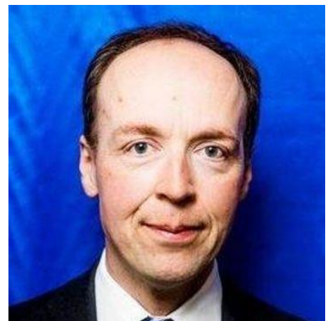
Kuva 4: Jussi Halla-aho