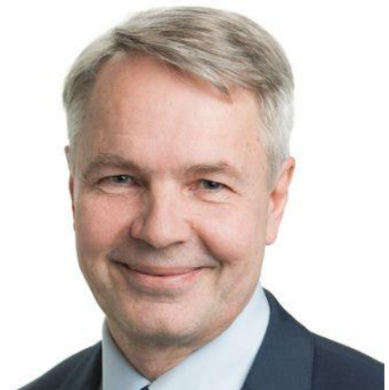
Kuva 6: Pekka Haavisto