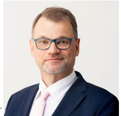
Kuva 9: Juha Sipilä