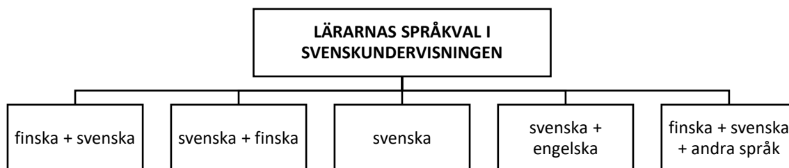
Figur 1. Lärarnas språkval i svenskundervisningen

Engelska och tyska är andra språk som svensklärarna anger att de ibland använder i klassrummet. Lärarna kan använda de andra språken antingen som stöd med elever som inte har finska eller svenska som modersmål eller för att jämföra svenskan med dessa språk. Som det framgår av intervjuerna finns det med andra ord en stor variation i vilket eller vilka språk som används i undervisningen (se figur 1).