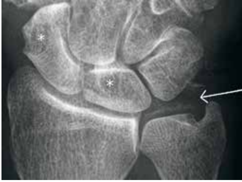
KUVA 1. Oikean ranteen PA-kuva, suurennettu kolmioruston seudusta. Värttinaluun ja proksimaalisen ranneluurivuston välinen nivelrako lievästi madaltunut ja nivelpintojen alaista skleroosia havaittavissa. Nivelessä lievät degeneratiiviset muutokset. Veneluussa ja puolikuuluussa (os lunatum) kystat (tähdet), veneluussa kookkaampi ja puolikuuluussa pienempi. Kolmioruston kalkkiuumaa (nuoli). Vasemman ranteen löydökset olivat lähes identtiset.