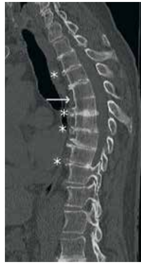
KUVA 3. Rintarangan sagitaalinen tietokonetomografialeike. Rintarangan keskivaiheilla huomattavaa diskusmadaltumaa ja päätelevyissä degeneratiivisia muutoksia, rintarangan keskivaiheilla miltei luutunut diskusväli (nuoli). Väleissä, joissa on vielä diskusta, nähdään varsinkin anteriorisesti syykehän (anulus fibrosus) kalkkiuraa (tähdet).

Akuutti valeskelekohtaus ja siihen liittyvät turvotus, punoitus ja kuumotus voivat olla vaikeasti erotettavissa akuutista kihti-kohtauksesta tai septisestä artriitista (4). Sinällään nivelnesteeseen positiivinen kidelöydös ei sulje pois samanaikaista bakteeritulehdusta, ja varsinkin akuutin monoartriitin yhteydessä septinen arttriitti on syytä sulkea pois. Tyypillisestä kihti-kohtauksesta poiketen niveltulehdus voi jatkua viikkojen ja jopa kuukausien ajan, kuten potilaallamme (1). Kun pyrofosfaattiarthropatia vau-