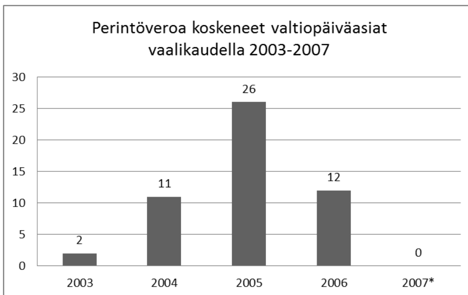
Kaavio 2: Perintöveroa koskeneet valtiopäiväasiat 2003–2007 154

Ruotsin perintöverotuspäätös heijastui suoraan perintöverosta käydyin keskustelun aktiivisuuteen vaalikauden 2003–2007 aikana. Kuten kaaviosta 2 on nähtävissä, perintöveroa koskeneet valtiopäiväasiat kasvoivat merkittävästi vuosina 2004 ja 2005. Vuonna 2003 perintöveroa koskevia valtiopäiväasioita oli vain kolme. Vuosina 2004 ja 2005 perintöverosta tehtiin useita kirjallisia ja suullisia kysymyksiä ja etenkin joidenkin yksittäisten kansanedustajien voidaan havaita alkaneen käydä nimissään aktiivista perintöverokeskustelua.