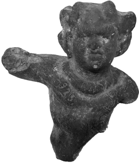
Kuva 6. Eversti Filipenkon seppelpäistä satyri- poikaa esittävä terrakottafiguriinin fragmenti. Kork. 7,7 cm.

oleva punakuviainen hajustepullo myöhäis- klassiselta ajalta, lasta esittävä terrakottafiguriini (Kuva 6.) ja kuljetusamforan kahva hellenistiseltä ajalta, vaatimaton hajustepullo roomalaisajan alusta sekä vihreä lasiamfora ajanlaskun alkuvuosisadoilta. 44 Julkaisematomatkin osat vahvistavat kuvaa tavanomaisesta arkiesineistöstä, joka luultavasti oli peräisin pitkään käytössä olleelta asuinpaikalta. 45