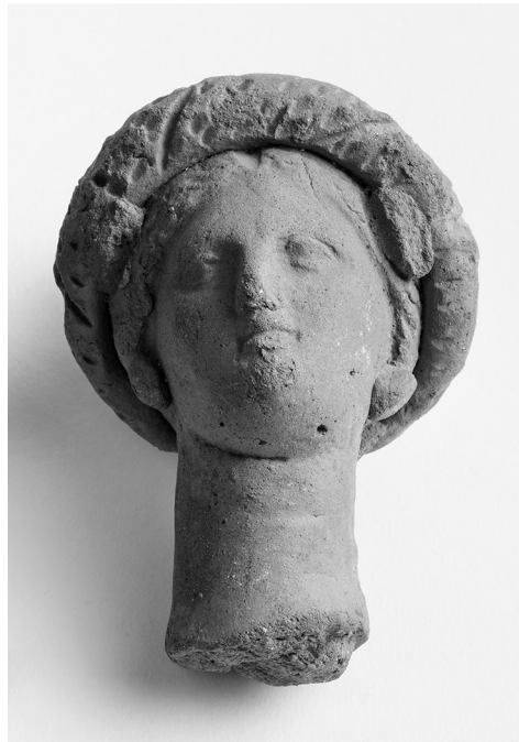
Kuva 3. Ilmonin Paestumista tuoma terrakottainen naisenpää 100-luvulta eKr. Kork. 8,5 cm.

Yliopisto-opettajien ohella muutkin lahjoittivat tulauskokoelmiaan yliopistol-