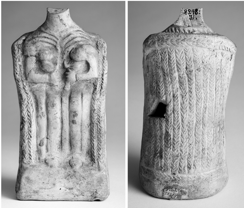
Kuva 12. Korituolissa istuva äiti kaksosvauvoineen Galliasta 100-luvun alusta. Kork. 14,6 cm.