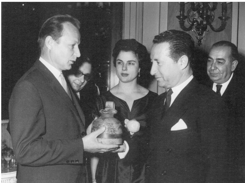
Kuva 19. Kreikan opetusministeri luovuttaa korinttilaisen viinikannun Suomen opetusministerille, kuva sanomalehti Vradinissa 28.10.1958.