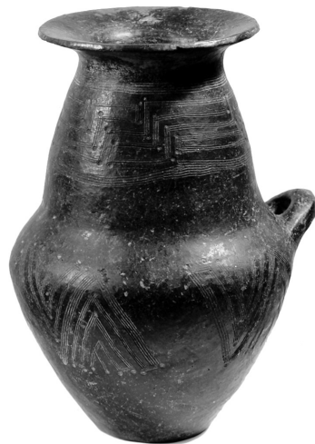
Kuva 14. Sara Hildénin taidemuseon kaksoiskartion muotoinen tuhkauurna Villanova-keramiikkaa 800-luvulta eKr. Kork. 35,5 cm.