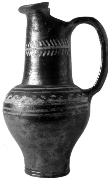
Kuva 23. Faliskilaisalueelle ominainen viinikannu 200-luvulta eKr. Kork. 19,3 cm.