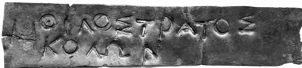
Kuva 11. 300-luvulla eKr. eläneen puhuja Filostratoksen pronssinen äänestyslevy. Mitat 11 x 2,0-2,5 x 0,1 cm.