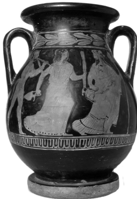
Kuva 16. Ateenalainen punakuviuvaasi 400-luvulta eKr. Kuva-aiheena Dionysos-jumala soihtua kantavan menadin ja hui-lua soittavan satyyrin seurassa. Kork. 28 cm.